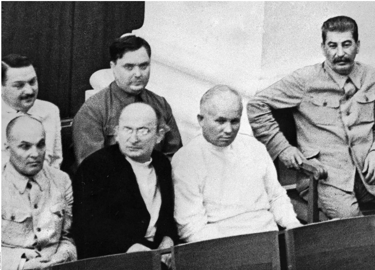
Первая сессия Верховного совета СССР. Здесь Хрущев и Берия (сидят в центре) еще соратники по сталинскому политбюро

Андрей Андреевич объяснил: Германия восстанавливается как единое, независимое, демократическое, нейтральное и миролюбивое государство. Все оккупационные войска выводятся. Германия даже получает право создать собственную армию.