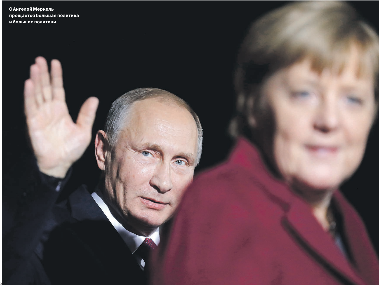
С Ангелой Меркель прощается большая политика и большие политики

Меркель делает ставку не на концепции, а на вторичные достоинства: она не оставляет свою позицию по тому или иному вопросу, как на боксерском ринге, а скрывает ее. Ей нужны не друзья, а союзники. Она