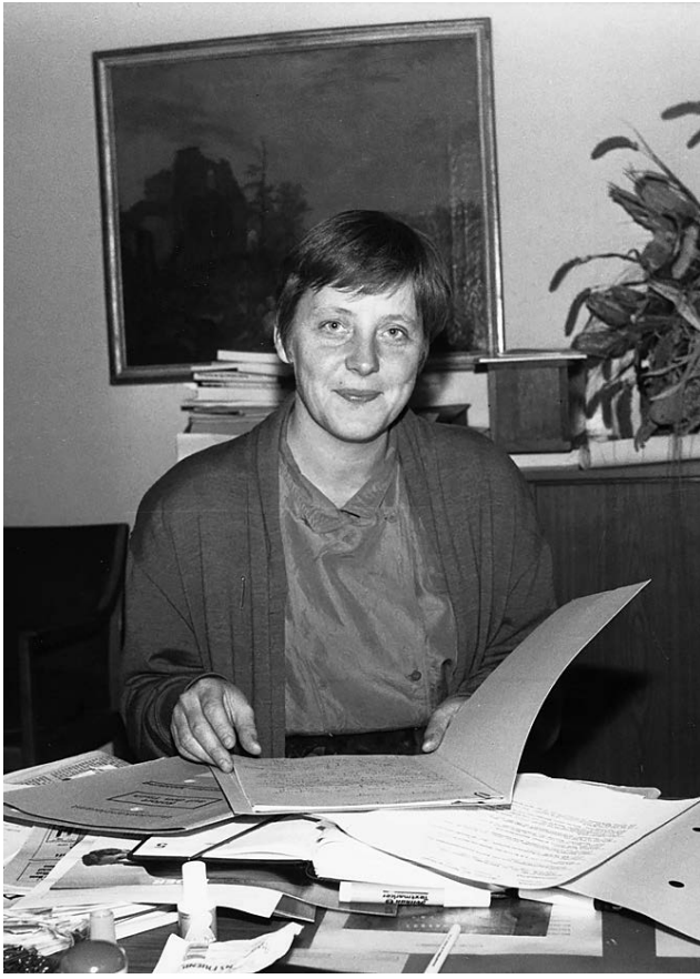
1990 год. На заре политической карьеры в ГДР