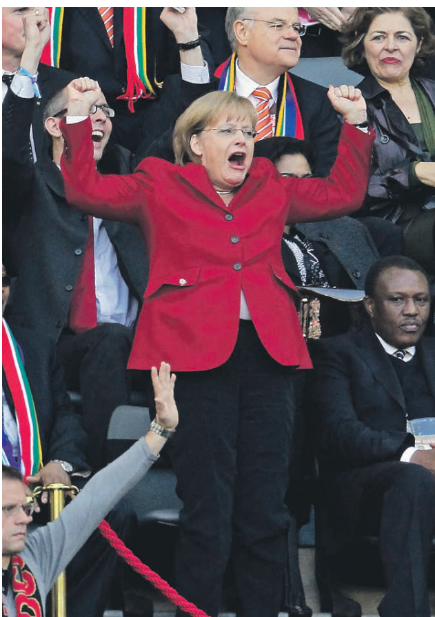
Ничто футбольное канцлеру не чуждо