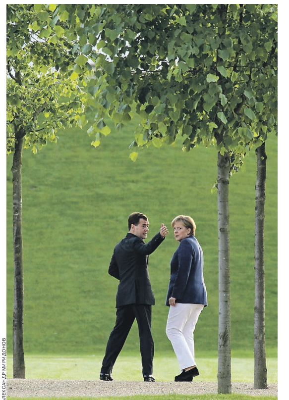
2010 год. Визит Дмитрия Медведева в замок Мезеберг закончился прогулкой