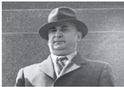
Как Берия объединял Германию. Исследование Леонида Млечина стр. 7