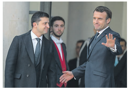
Война — дело долгое. На чем затормозили переговоры вокруг Донбасса стр. 3