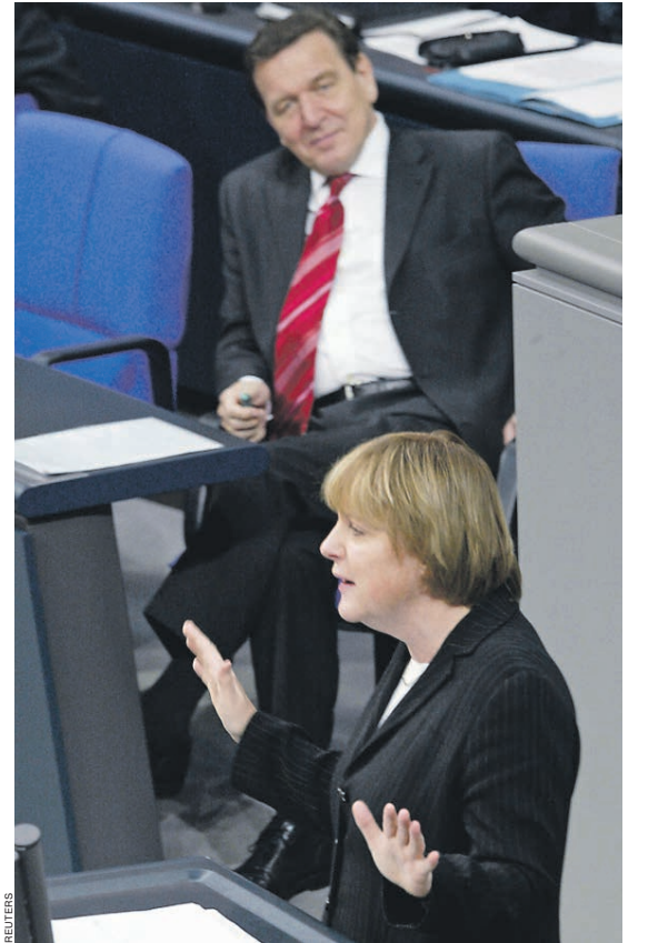
2002 год. Герхард Шрёдер с интересом наблюдал за Меркель, пока она не выиграла у него пост канцлера