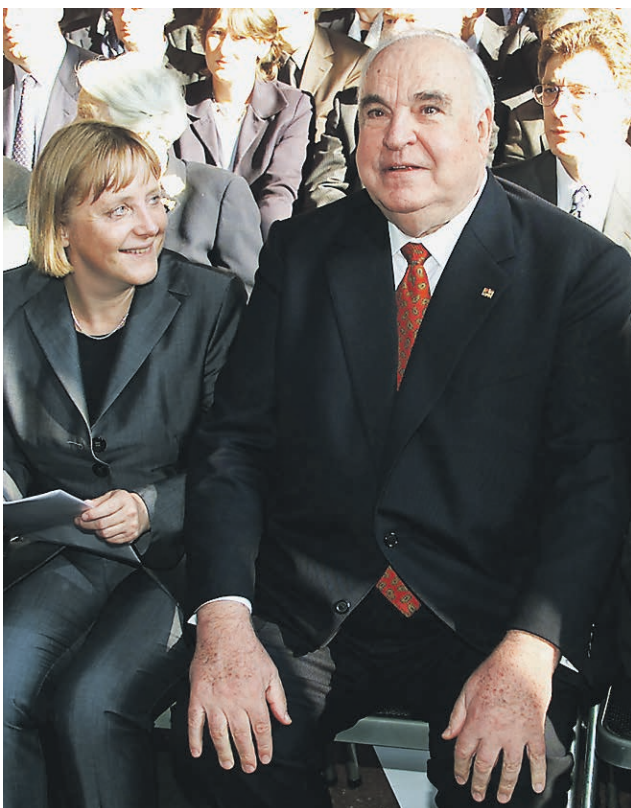
2000 год. Ученица Гельмута Коля оказалась так талантлива, что подвинула его с поста главы партии