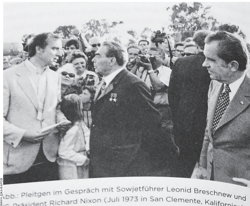
Фриц Пляйтген беседует с Л. И. Брежневым и президентом США Ричардом Никсоном (июль 1973 г. Сан-Франциско, Калифорния)

Дороги были в очень плохом состоянии, заправки на советской территории встречались настолько редко, что ездить без запасной канистры было немисливо. Зимой оно было запросто улететь с обледеневшей трассы в кювет или неожиданно встать перед снежным заносом. Летом в сумерках приходилось вглядываться, чтобы вовремя среагировать, если вдруг кто-то после бутылки-другой водки решал пропастись на теплом асфальте. Дороги в Польше были чуть лучше, но тоже далеки от идеала. Расслабиться на