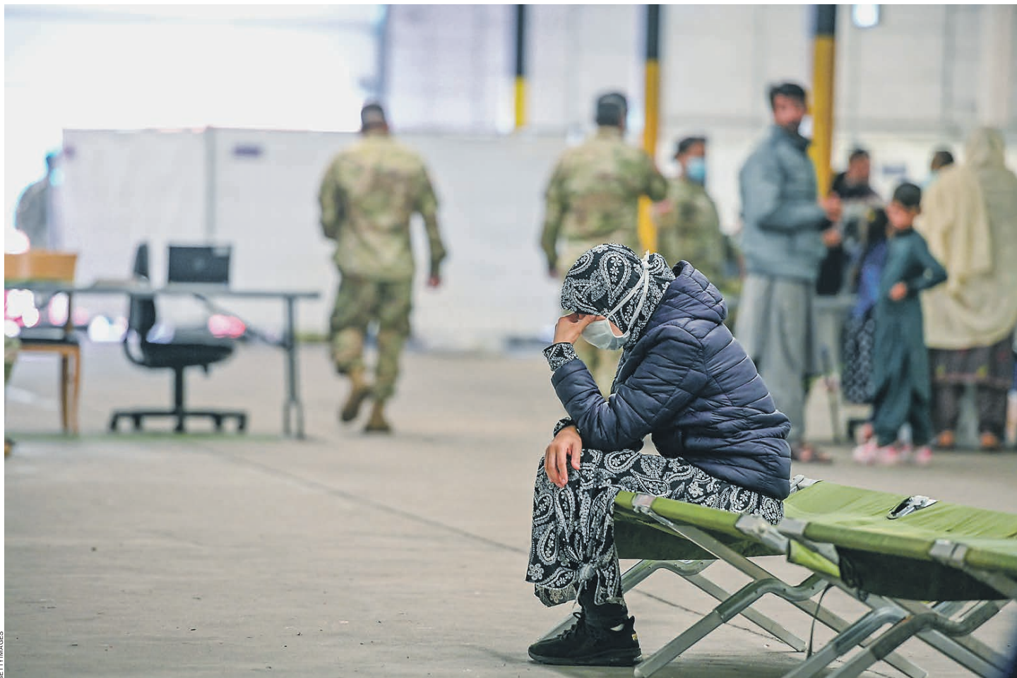
Утолько-только прибывших в немецкий лагерь для беженцев афганцев теперь лишь один вопрос: как сложится их жизнь на новой земле?

Драматические репортажи из кабульского аэропорта пробудили у немцев, наоборот, чувство сострадания, морального дискомфорта, если не вины. Даже лидер АдГ Алиса Вайдель признала, что нельзя бросать тех, кто сотрудничал с Бундесвером. Правда, она тут же добавила, что никаких других афганцев пускать в страну нельзя. Эта позиция широко представлена и в соцсетях. Там идут нервные дискуссии о безопасности, которые подпитываются информацией МВД.