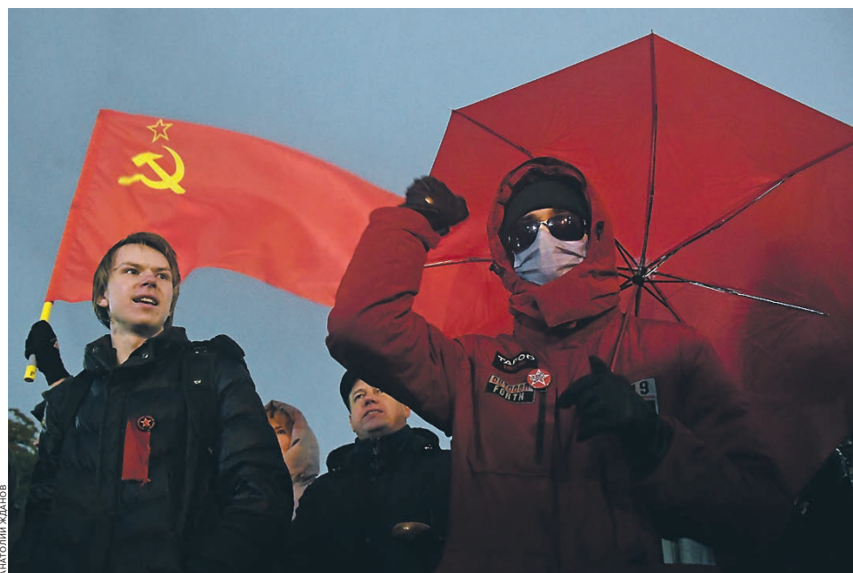
Набрав на выборах в Госдуму неожиданно много — почти 19% — голосов, коммунисты остались недовольны итогами и 20 сентября провели митинг в центре Москвы

Несколько более подробными и проработанными выглядят внешнеполитические инициативы «Единой России» и партии «Новые люди». В «Единой России» сухим бюрократическим языком обещают «решительно отстаивать национальные интересы России во внешнеполитической сфере», поддерживать соотечественников за рубежом, развивать интеграционные структуры (ЕАЭС,