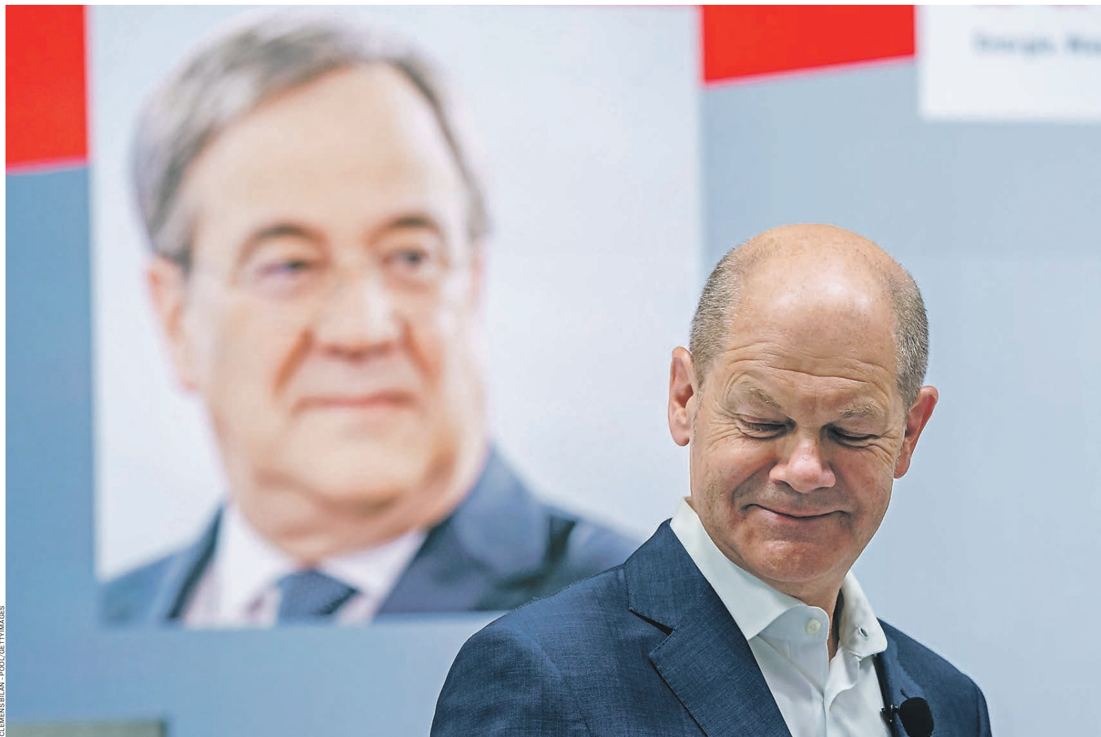
Радость победы очень скоро сменится у лидера СДПГ Олафа Шольца на тяжелые размышления о границах компромисса с партнерами по коалиции

Да, социал-демократы набрали большинство голосов. Благодаря авторитету их кандидата на пост канцлера Олафа Шольца им удалось вернуть себе наступательную динамику. Еще полгода назад победа на выбо-