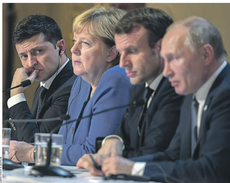
Суждено ли им договориться? На фото: Владимир Зеленский, Ангела Меркель, Эммануэль Макрон и Владимир Путин во время переговоров «нормандской четверки»

Анонимный украинский переговорщик сообщил, что во время работы над проектом текста итогов саммита Москва «упорно пыталась снять с себя ответственность за конфликт с Украиной, вновь выступая за то, чтобы вписать в итоговый документ саммита сепаратистов Донбасса как