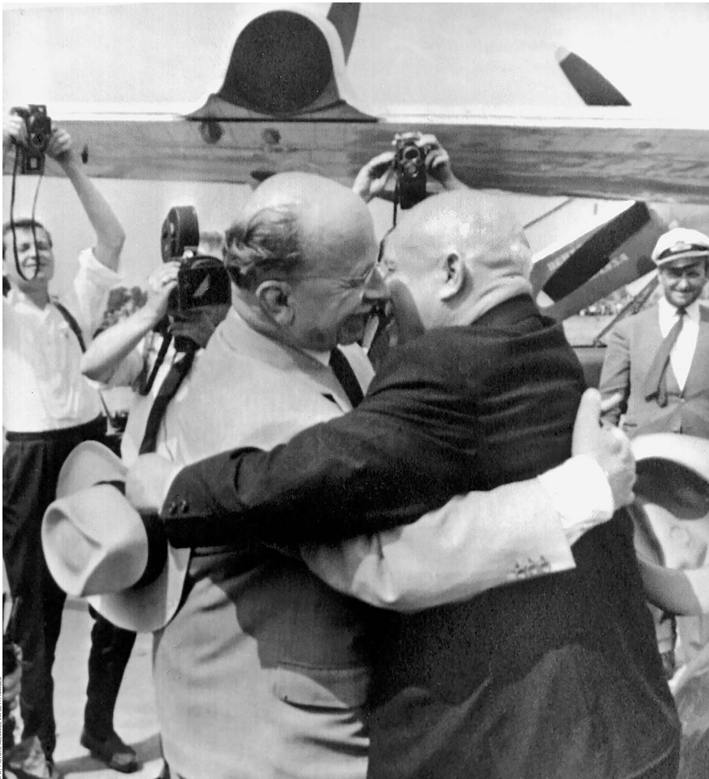
Хрущев не хотел выпускать из своих объятий ни ГДР, ни ее лидера Вальтера Ульбрихта. На фото: прощание в заключение визита советского генсека в ГДР в 1957 году

Советский верховный комиссар в Германии Владимир Семенов записал в дневнике: «Узнал, что Молотов был против распространения обязательств по Варшавскому договору на ГДР. И в этом он повторил Сталина, который хотел использовать ГДР как предмет борьбы, но не был уверен, что сможет удержать эту позицию. Значит, Берия вел ту же линию, но хотел только форсировать ее летом 1953 года. И провалился как раз на этом. А для меня это был вопрос жизни».