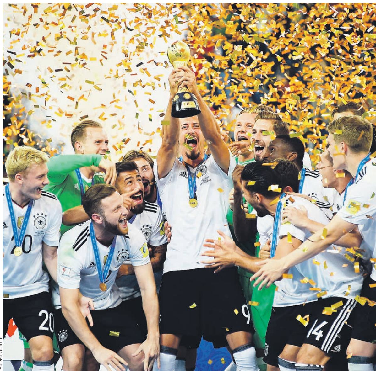
2017 год. Санкт-Петербург. Только что сборная Германии победила в Кубке конфедераций

Эти 68 бойцов Сопротивления выступали за человеческие ценности, поправные представителями нацистского государства. Тем трогательнее было наблюдать за сотнями французских детей и молодых