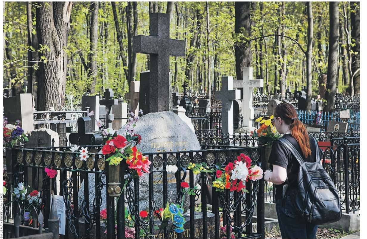
Могилка доктора Гааза на Введенском кладбище в Москве

В то время в камерах Бутырской тюрьмы в Москве царил ад, не было ни окон, ни нар, ни возможности хотя бы умыться. Гааз превратил Бутырку в образцово-показательное пенитенциарное учреждение со светлыми, чистыми камерами, умывальниками и мастерскими для заключенных. Для этого он залезал в собственные средства и брал в долг, когда их не хватало. Поэтому чиновники, отвечавшие за тюремный надзор, считали его экстравагантным филантропом, готовым баловать роскошью всякий сброд. Заключенных Гааз не боялся, должно быть, потому, что сквозь внешнюю грубость он всегда видел человеческие судьбы. Больше всего его угнетала мысль о тяжелых железных цепях, которыми сковывали ссыльных, пешком отправлявшихся в Сибирь — дорога занимала месяцы. Приговоренных даже за легкие преступления — белых рекрутов, крепостных, нарушивших паспортный режим, среди которых было много женщин и детей, — вешестером приковывали к металлической штанге, чтобы исключить побег. Им приходилось не только идти в такой связке, но и спать, и справлять нужду. Трупы умиравших в пути волокли до очередного этапа. Гааз добился упразднения штанги. Кроме того, ему удалось замечать тяжелые кандалы, истирившие