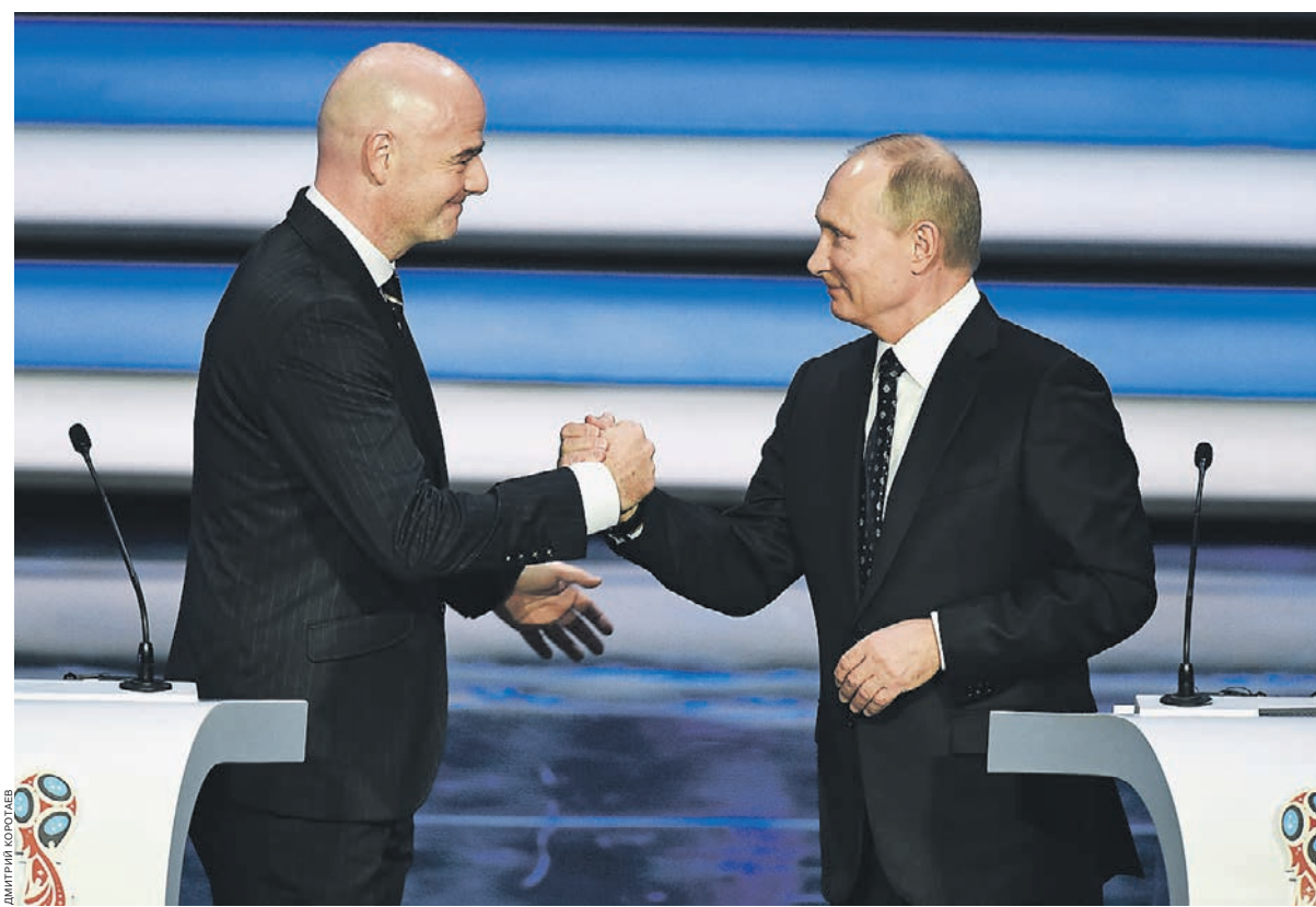
У лидера российской политики и лидера мирового футбола президента UEFA за эти годы сложились прекрасные отношения. На фото: Владимир Путин и Джанни Инфантино во время жеребьевки чемпионата

Российские региональные власти начали бороться за право принимать матчи чемпионата. Всего к первенству было реконструировано или построено 12 стадионов. Два из них находятся в Москве, по одному — в Санкт-Петербурге, Нижнем Новгороде,