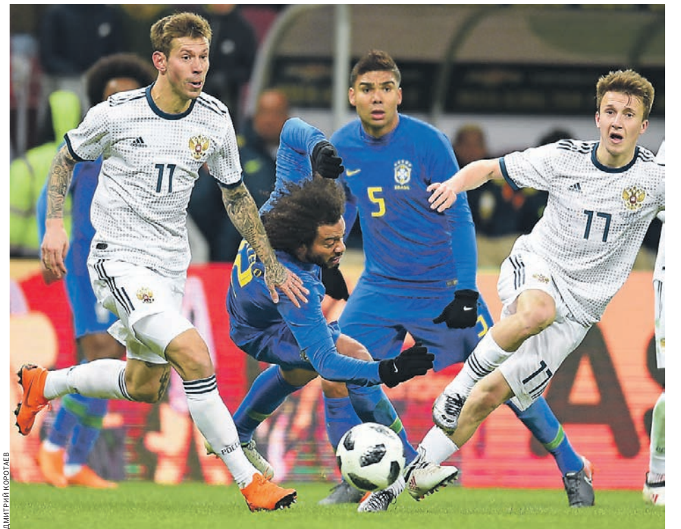
Одну из последних контрольных игр сборная России (в белой форме) провела с бразильцами

— Конечно, возможно. Но сначала отмечу, что само появление нового стадиона дает команде, на нем выступающей, рост посещаемости в 30–40%. Это видно на примере «Спартака» и вообще является мировой практикой. А вот насыщение стадиона другими мероприятиями — вопрос эффективности команды, которая занимается управлением ареной. Можно ведь просто нанять команду эксплуатантов, которые следят за счетчиками электричества, вовремя вентили открывают, воду сливают и так далее. А можно к ней прибавить коммерсантов, которые думают над тем, как минимизировать затраты на эксплуатацию. Хотя задача это непростая. Я вот не знаю ни одного стадиона, который бы окупился полностью. Стадион в целом нельзя назвать бизнес-проектом. Хорошо, если удастся хотя бы сбалан-