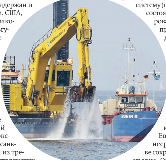
Германия. Лубмин. В прошлом месяце компания Nord Stream 2 AG начала подготовку к прокладке труб «Северного потока-2» в Балтийском море

И последнее: в Брюсселе постепенно растет понимание того, что усилия России по дальнейшей диверсификации газотранспортной инфраструктуры укрепляют, а не ослабляют энергетическую безопасность Европы. Немецкие партнеры вносят здесь свой позитивный вклад. Но до перелома в настроениях чиновников и многих политиков пока далеко.