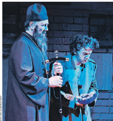
Сцена из оперы «Доктор Гааз», поставленной «Геликон-оперой»

Фридрих Йозеф Гааз появился на свет в Мюнстерайфеле в многолетней семье аптекаря. Он изучал медицину и философию в Кельне, Йене и Вене. Там молодой врач лечил тяжелый глазной недуг российского посла князя Репина, чьи родственники затем уговорили его уехать вместе с ними в Россию. Так в 26 лет Гааз оказался в Москве, где вскоре у него появилась процветающая врачебная практика. Трудолюбие, любознательность, заботливость принесли ему доверие па-