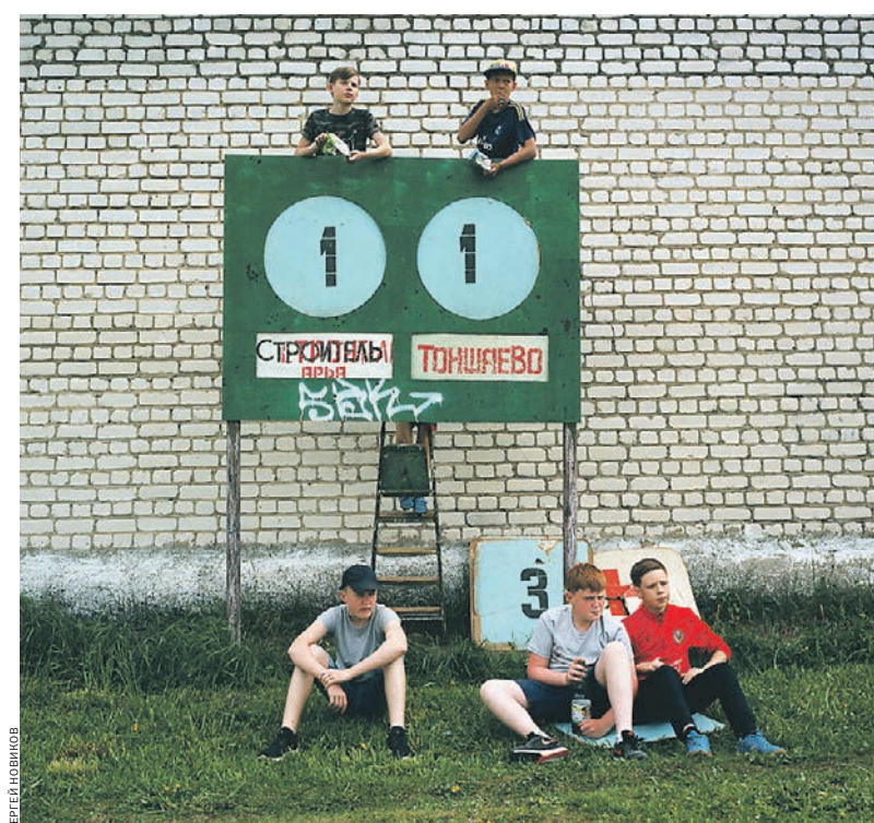
Арья, Нижегородская область