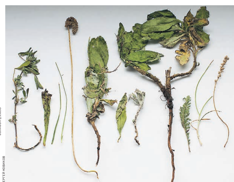
Гербарий с футбольного поля. Верхнеуральск, Челябинская область