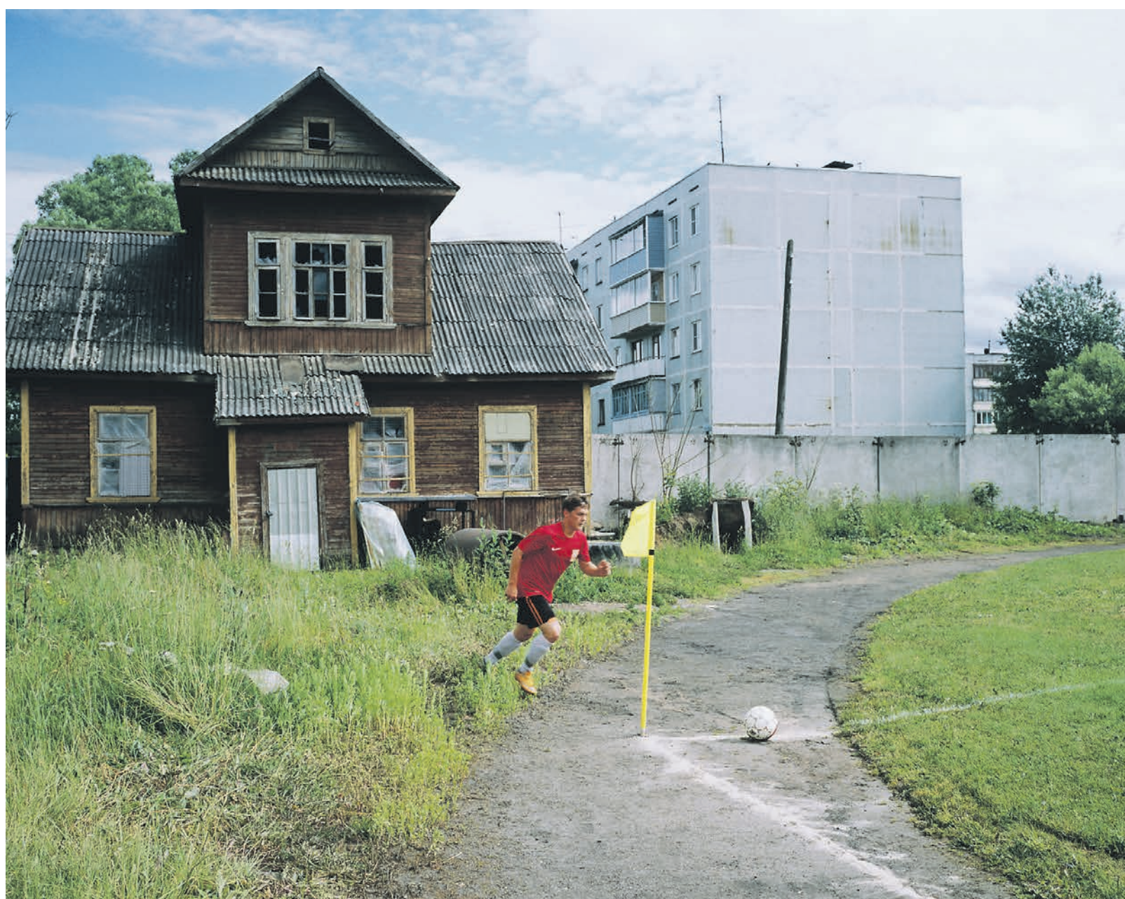
Бологое, Тверская область