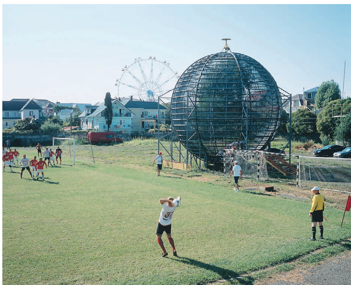
Лазаревское, Краснодарский край