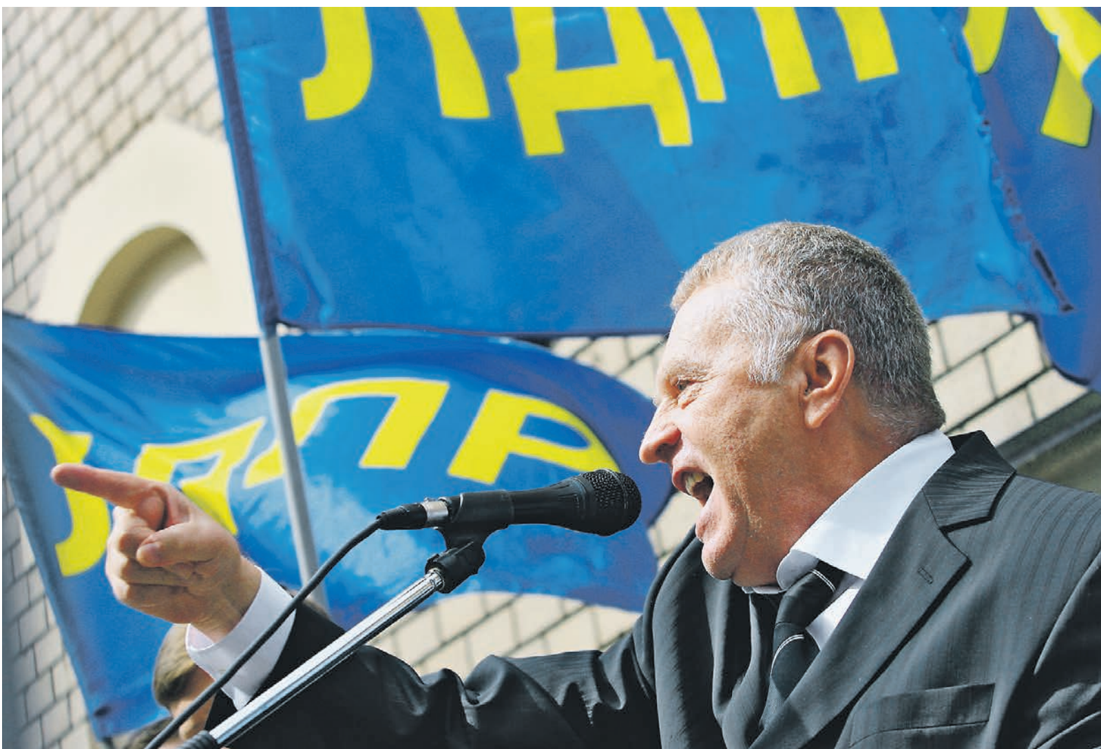
Российского политика Владимира Жириновского можно назвать ветераном популизма