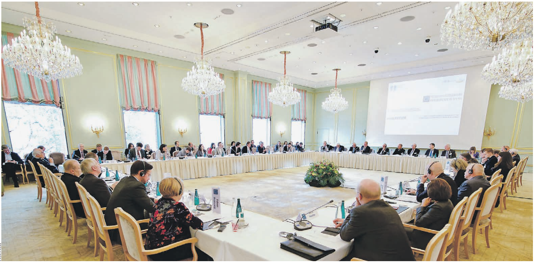
Берлин. Во время заседания

Хотя главных критических позиций немцы не сдали (аннексия Крыма и нарушение международных договоренностей в связи с ней, участие в войне вместе с сепаратистами в Донбассе, ядерное оружие, развернутое в Калининградской области), в целом, кажется, в ФРГ как-то больше стали понимать Россию. И прежде всего это касается вопросов санкций и отношения к доминированию Соединенных Штатов. Появился и мо-