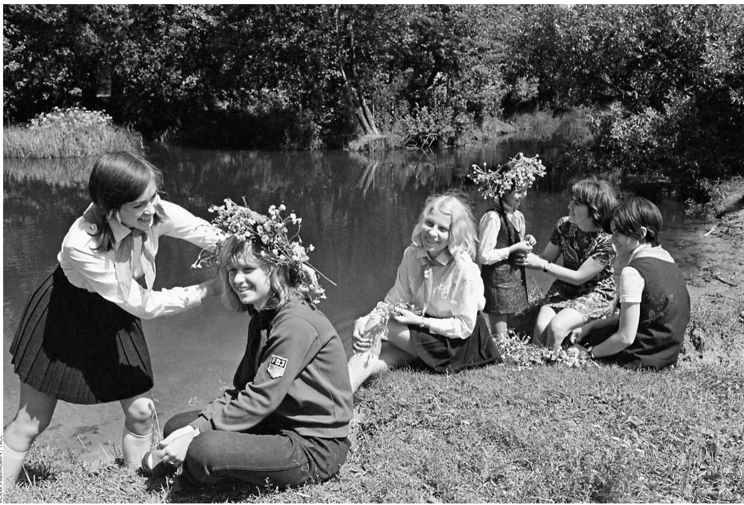
40 лет назад. Интернациональный пионерлагерь «Синезерки». Русские и немецкие школьницы плетут друг другу венки из полевых цветов

Не думаю, что я вправе читать нотации. Могу только испытывать разочарование, столь болезненное в мои годы. Но воспитанный на послевоенной немецкой литературе, я не теряю надежды. Тем более что мой сын, продолжая семейную традицию, выучил немецкий язык и защитил диссертацию о взаимоотношениях России и Германии.