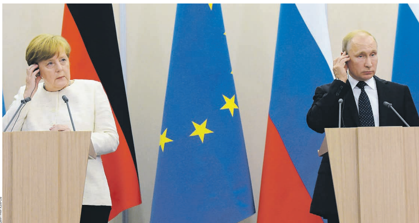
Теперь Германии и России непросто услышать друг друга. Майская встреча Ангелы Меркель и Владимира Путина в Сочи

Москва продолжает настаивать, чтобы Запад уважал пространство безопасности России и отказался от намерений принять Украину, Молдавию, Грузию или любую другую бывшую советскую республику в НАТО, чтобы международные кризисы, подобные сирийскому, ливийскому или корейскому, регулировались и улаживались бы совместно, под эгидой Совета Безопасности ООН, где у России есть право вето, и чтобы между Западом и Россией были восстановлены нормальные экономические связи. При этом вопрос о Донбассе должен быть разрешен на основе минских соглашений 2015 года — возможно, с помощью сил ООН, но не на ос-