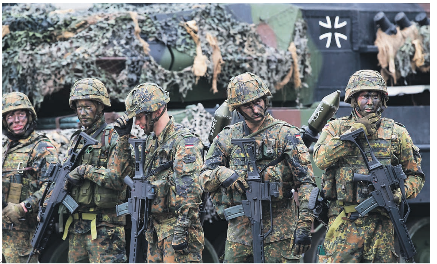
Немецкие солдаты НАТО на военной базе Рукла в 130 км от Вильнюса

— Как вы оцениваете сегодняшнее поведение политического руководства на Западе? — Гельмут Шмидт еще несколько лет назад жаловался на дефицит квалифицированных личностей на ведущих позициях в политике. Многим сегодняшним политикам явно не хватает дальновидности в контексте политики безопасности. Не хватает способно-