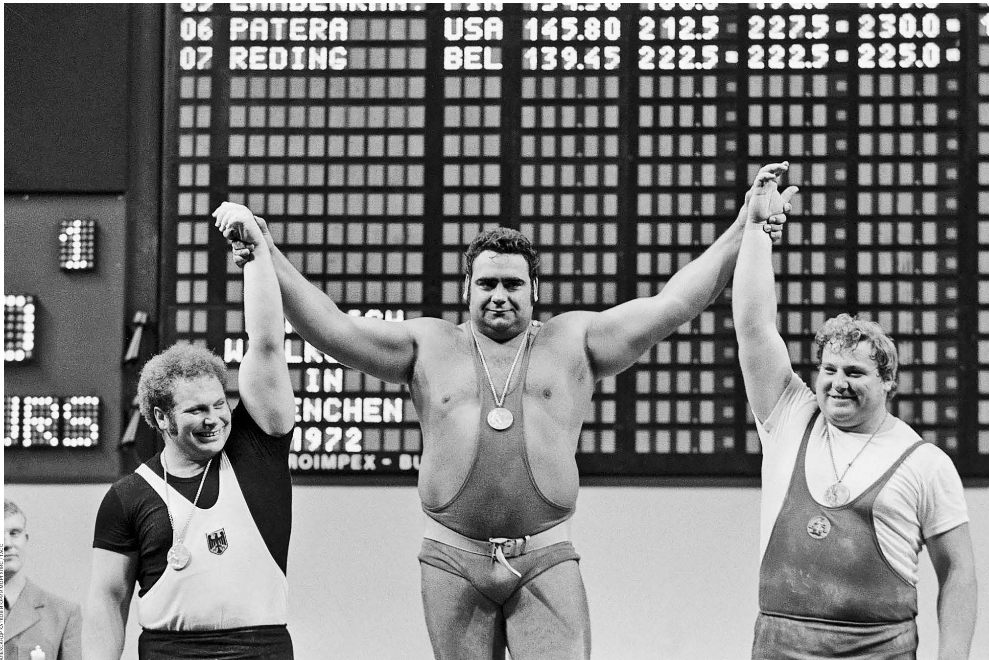
В Мюнхене Советский Союз завоевал 55 золотых медалей, но эта была особой: самым сильным человеком планеты стал Василий Алексеев. Пьедестал почета он разделил с немцами — Рудольфом Матом (серебро) и Гердом Бонком