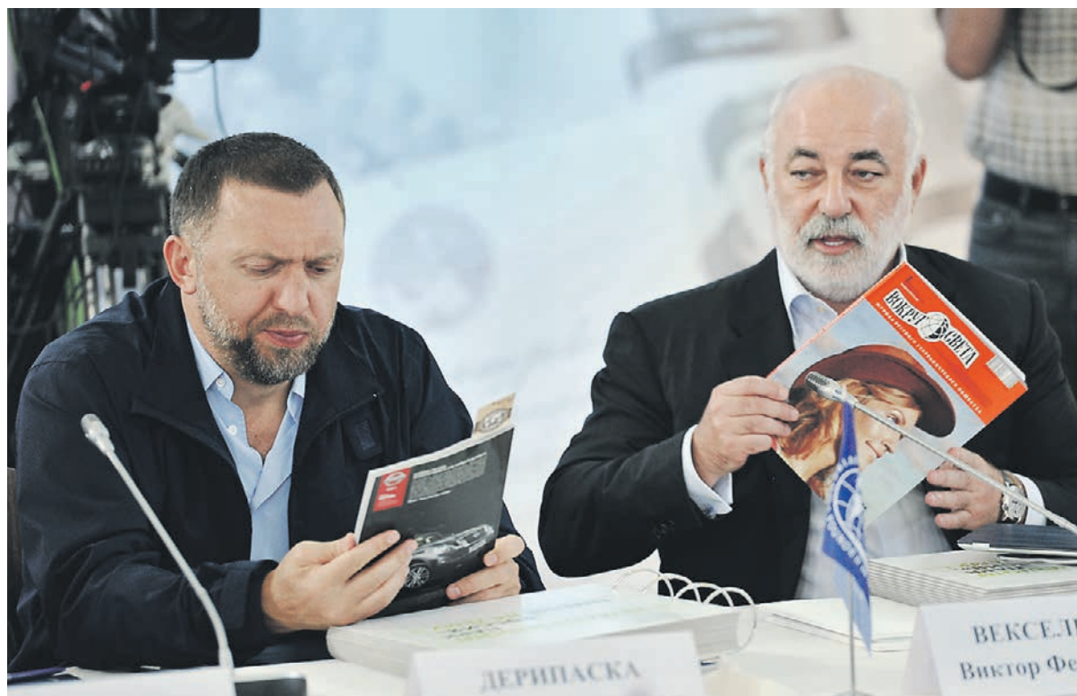
Санкции вынуждают российских предпринимателей оставлять свои посты. Возможно, у Олега Дерипаски и Виктора Вексельберга (на фото) теперь появится время для чтения журналов