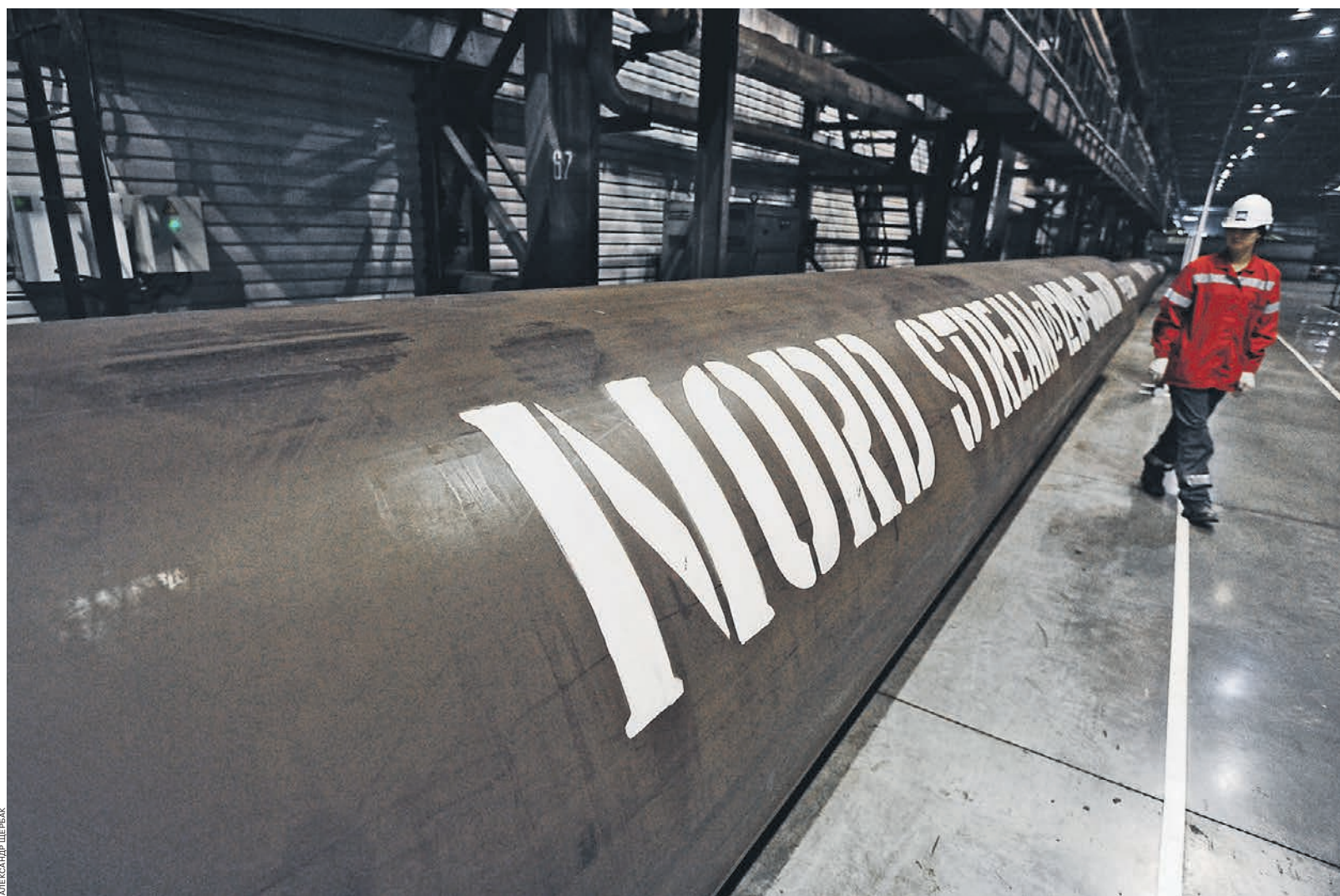
Последние американские санкции ставят осуществление Nord Stream-2 под вопрос

В этих условиях относительно неожиданным стало принятие в США в августе закона «О противодействии противникам Америки...» (Countering America's Adversaries Through Sanctions Act), предусматривающего далеко идущие карательные меры не только для американских, но и европейских субъектов, сотрудничающих с запрещенными российскими секторами, частными и юридическими лицами. Обновлением стали «нарушение территориальной целостности Украины, дерзкие кибератаки и вмешательство в президентские выборы в США, а также продолжающаяся агрессия в Сирии». Россия оказалась в списке с Северной Кореей, Ираном и международными террористами и названа «врагом» Соединенных Штатов.