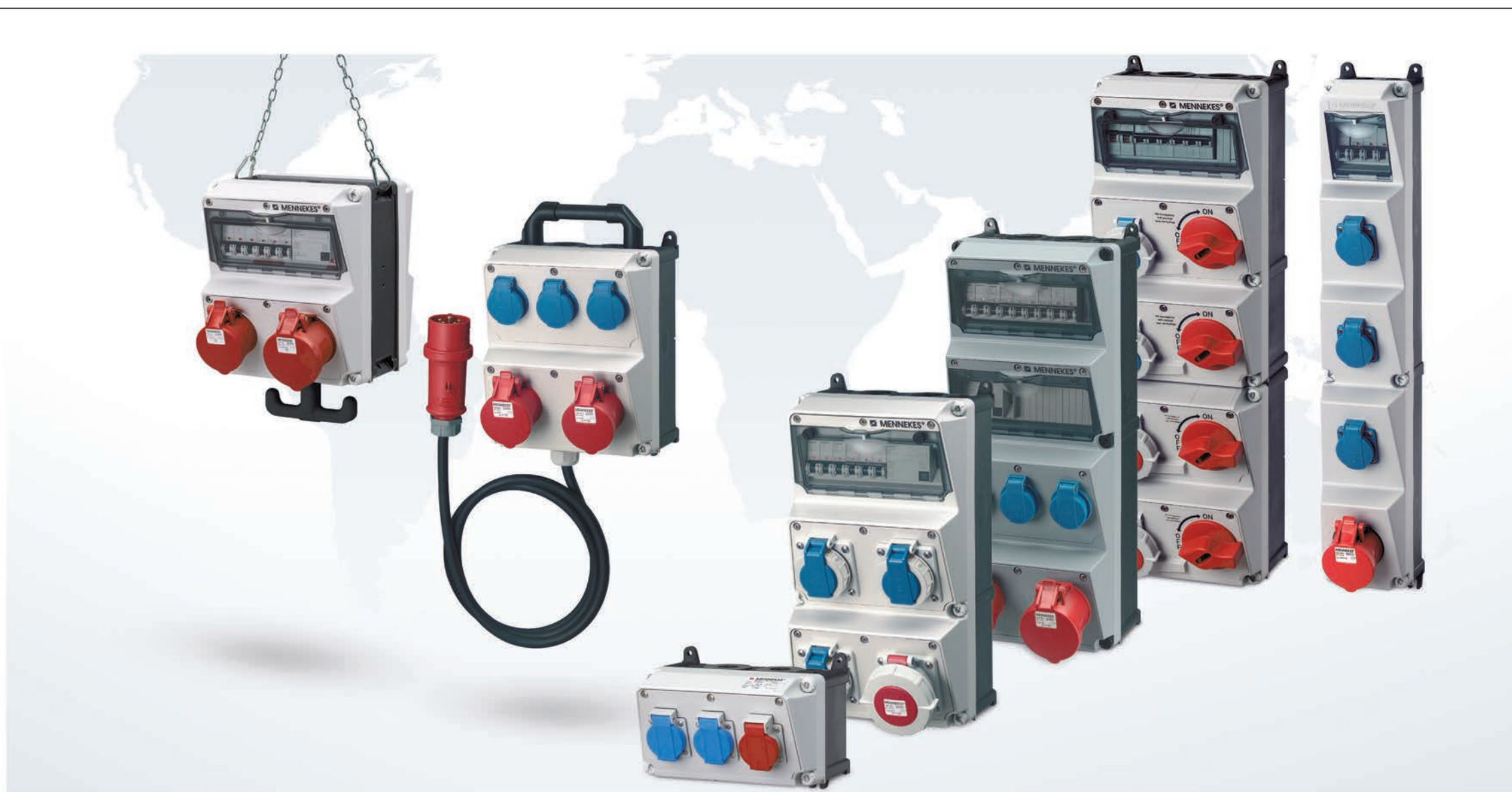
Герд Кёнен, «Красный цвет. Истоки и история коммунизма», €38 Карл Шлэгель, «Советский век. Археология погибшего мира», €38 (обе книги вышли на немецком языке в издательстве С. Н. Вебек)

AMAXX® Комбинации розеток для использования по всему миру.