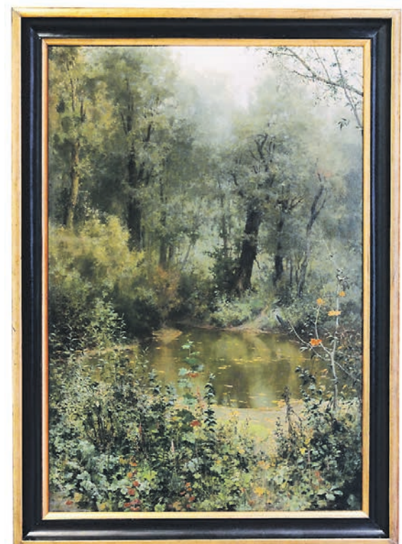
Василий Поленов «Пруд с ветлами» (1881 год)

«Утрата и обретение» — так называлась одна из первых инициатив DRMD, основанного в 2005 году. Поводом послужила 50-я годовщина второй крупной акции по возвращению Советским Союзом более чем 1,5 млн произведений искусства Германской Демократи-