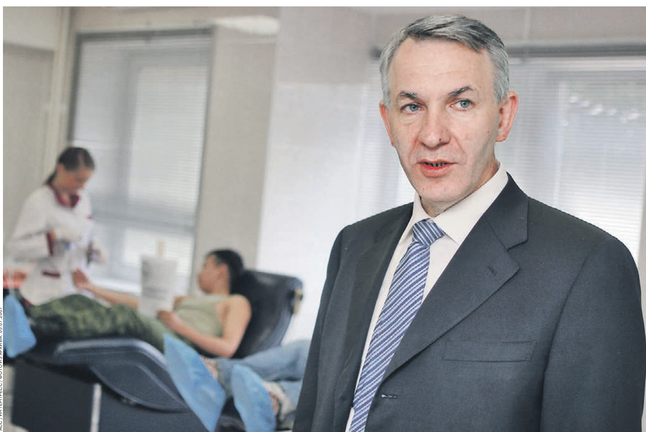
Матей Литвиненко © Фото: Матей Литвиненко

Однако, как ни удивительно, теперь ученому и организатору науки трудно выделить какой-то собственный научный интерес: время творцов-одиночек в медицине прошло, как мне кажется. Сегодня только на основе междисциплинарного взаимодействия сильных исследовательских коллективов возможен прорыв в той или иной области. И, разумеется, в сотрудничестве с нашими зарубежными коллегами. Примером может служить наше успешное участие в выполне-