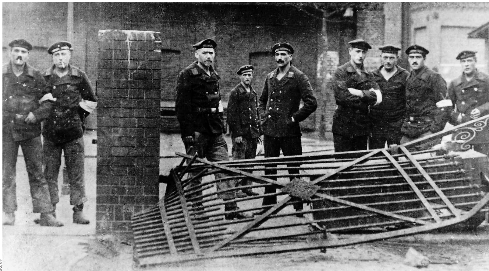
Моряки после штурма следственного изолятора на Кенигштрассе в Вильгельмсхафене 6 ноября 1918 года

Когда батальон основательно потрепали, старослужащих, в том числе Гитлера, призвали в ефрейторы. Но почему Гитлер больше не получил повышения? Бывший начальник штаба полка объяснял после войны, что намеревался произвести Гитлера в унтер-офицеры, но «не обнаружил в нем командирских качеств». Однополчане думали иначе: получить повышение означало отправиться в окопы, где было опасно. Гитлер предпочел оставаться ефрейтором — подальше от линии фронта и вражеского огня.