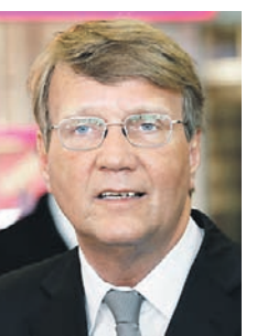
Рональд Пофалла , сопредседатель форума «Петербургский диалог» с немецкой стороны

В этом году «Петербургский диалог» впервые за свою 16-летнюю историю пройдет в немецкой столице. Берлин, как ни один другой город страны, был ареной общей истории Востока и Запада. Падение Берлинской стены, служившей символом раскола и конфронтации, 9 ноября 1989 года показало миру, на что способны мирные граждане: в Берлине они преодолели не только границы, но и противоречия, казавшиеся антагонистическими. История города, некогда разделенного на два лагеря, воодушевляет и вдохновляет всякого, кто стремится к взаимопониманию, хочет положить конец конфронтации, засыпать траншеи и окопы.