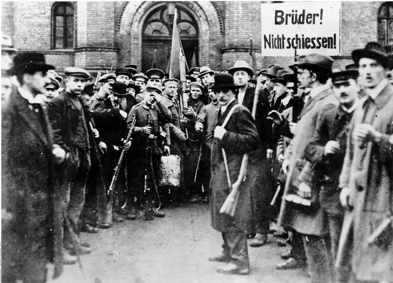
Представители солдатских и рабочих советов перед уланскими казармами, которые сдались им без боя. Берлин, 1918

«Однажды вечером бледный человек скользнул в укрытие — как только нас начали обстреливать, — вспо-