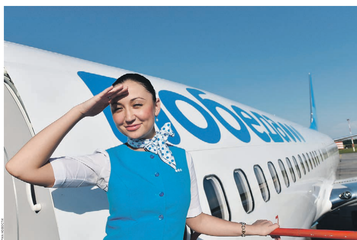
«Победа» наконец-то прилетела в Баден-Баден