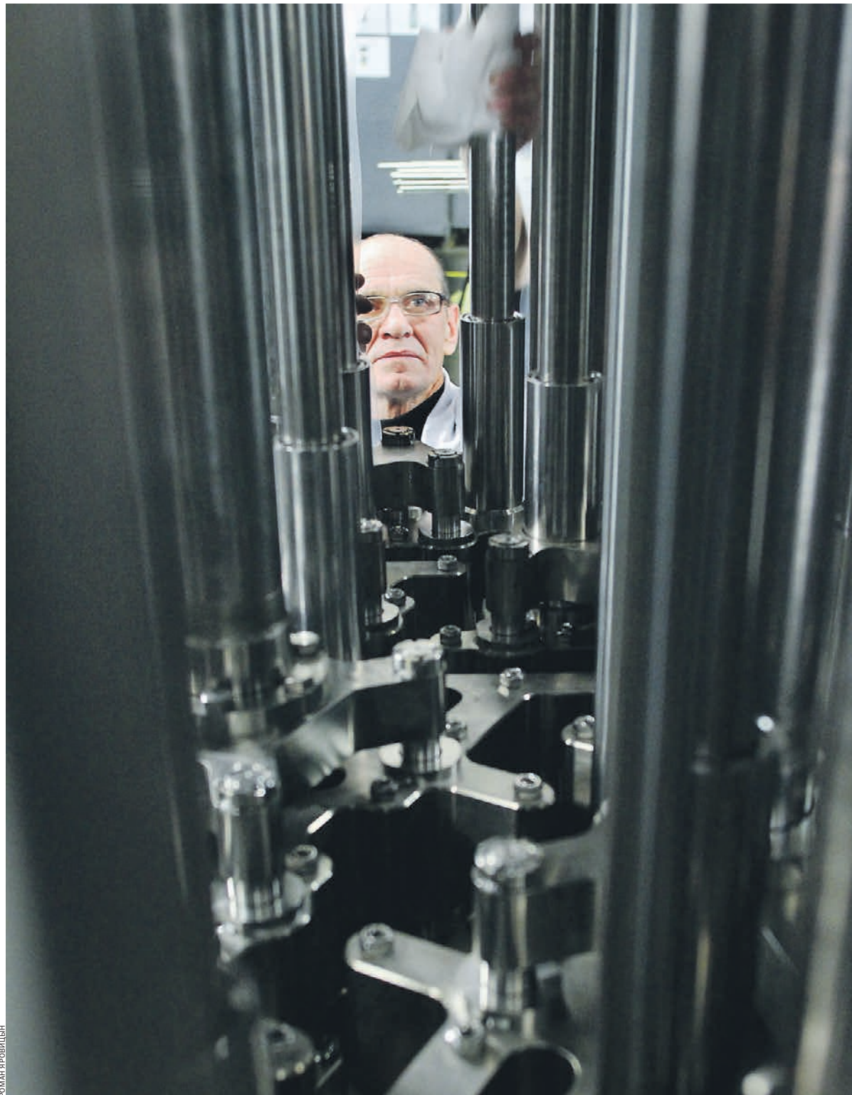
Старение работающего населения и его страхование является проблемой и для Германии, и для России