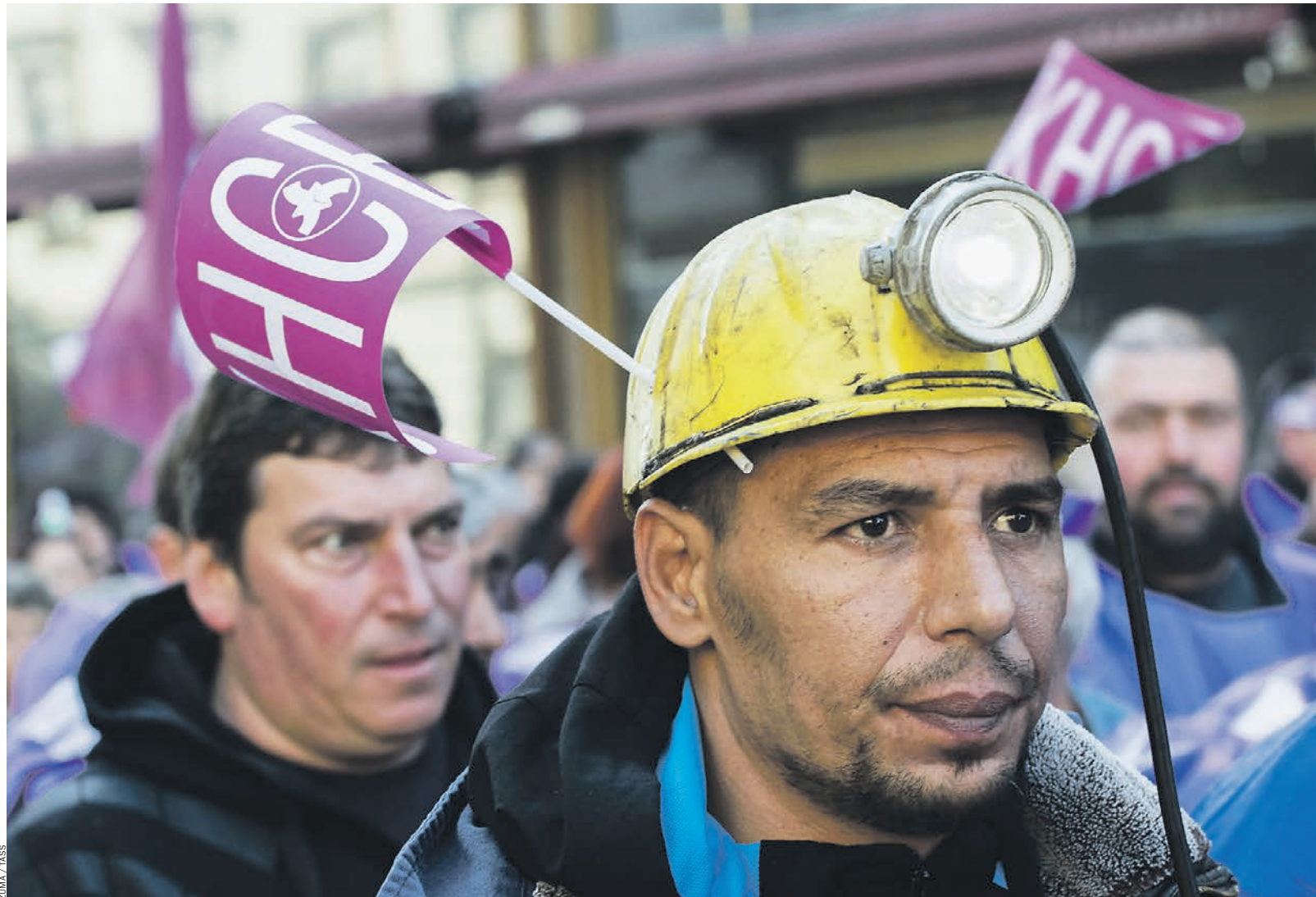
Октябрь 2017-го. В Софии очередная акция протеста. На этот раз против низких зарплат

В политике тоже все спокойно, особенно если сравнивать с теми турбулентными временами, через которые Болгария прошла в по-