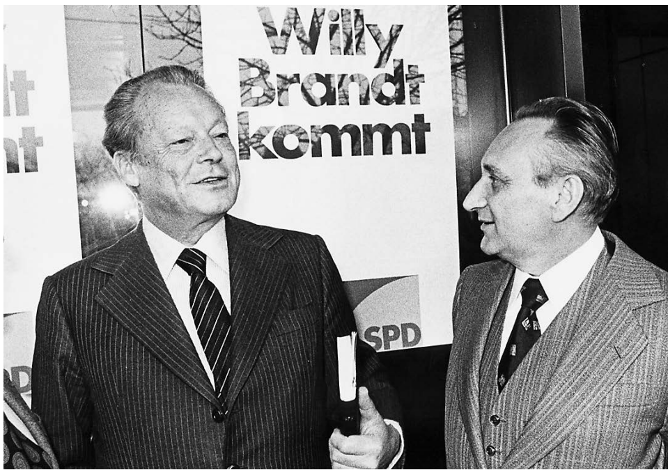
Эгон Бар, генсекретарь Социал-демократической партии и один из ключевых архитекторов Ostpolitik (слева), приветствует председателя партии Вилли Брандта в Бонне в 1979 году

15 июля 1963 года Вилли Брандт в Евангелической академии в Путциге впервые заговорил о наличии в Востоке и Западе «общих интересов в сфере безопасности». На первые полосу газет попала сопроводительная речь Эгона Бара, для которой один из его сотрудников подобрал броский заголовок «Перемены через сближение»: «Трансформация Зоны должна происходить с одобрения советского