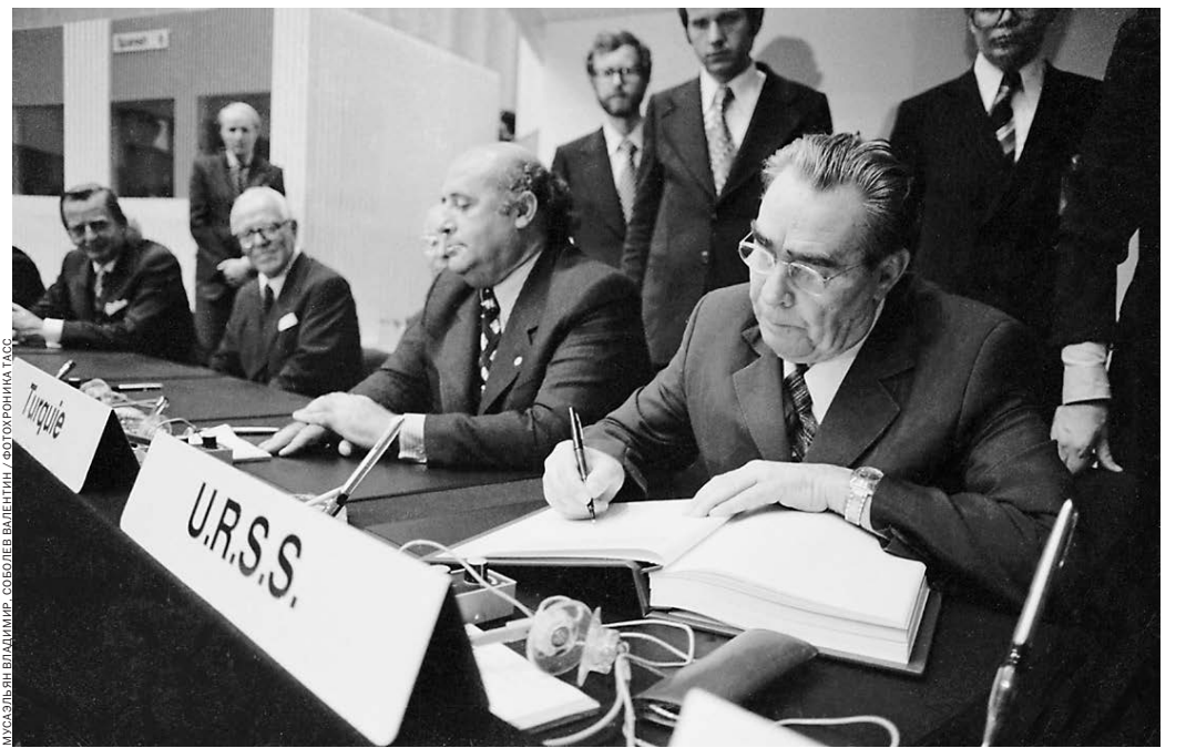
Подписание Заключительного акта Хельсинкского соглашения. От СССР свою подпись ставит Леонид Брежнев