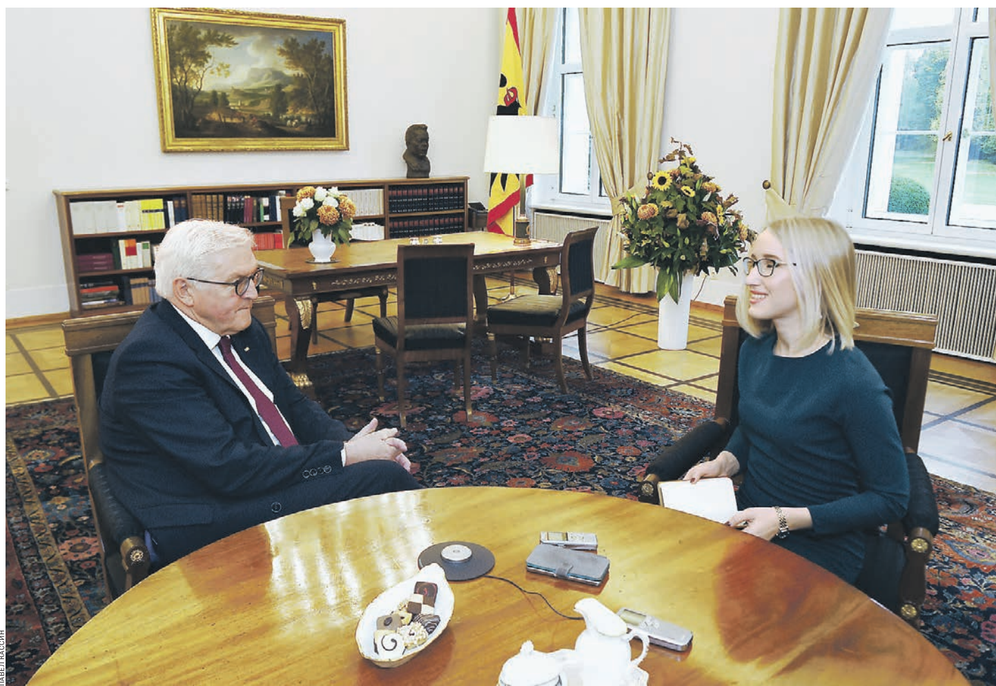
В кабинете президентского дворца Франк-Вальтер Штайнмайер дает интервью автору «Д» Галине Дудиной

«Иногда мы и сами не знали, что в большей степени определяло наши отношения — близость или отдаленность»