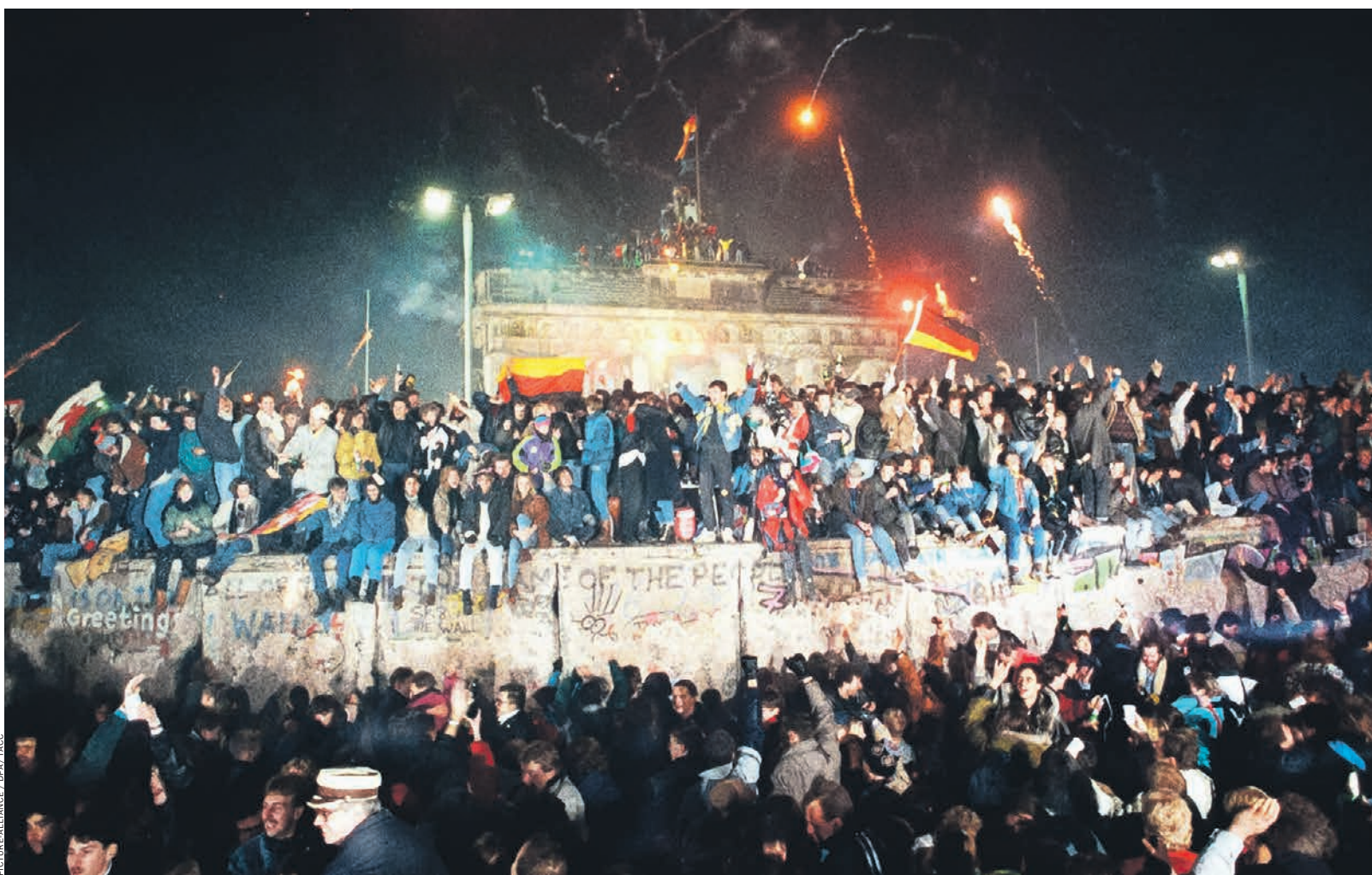
Конец Берлинской стены — это тоже в значительной степени наследие Брандта

руководства. Если это удастся, тем самым мы сделаем большой шаг к воссоединению».