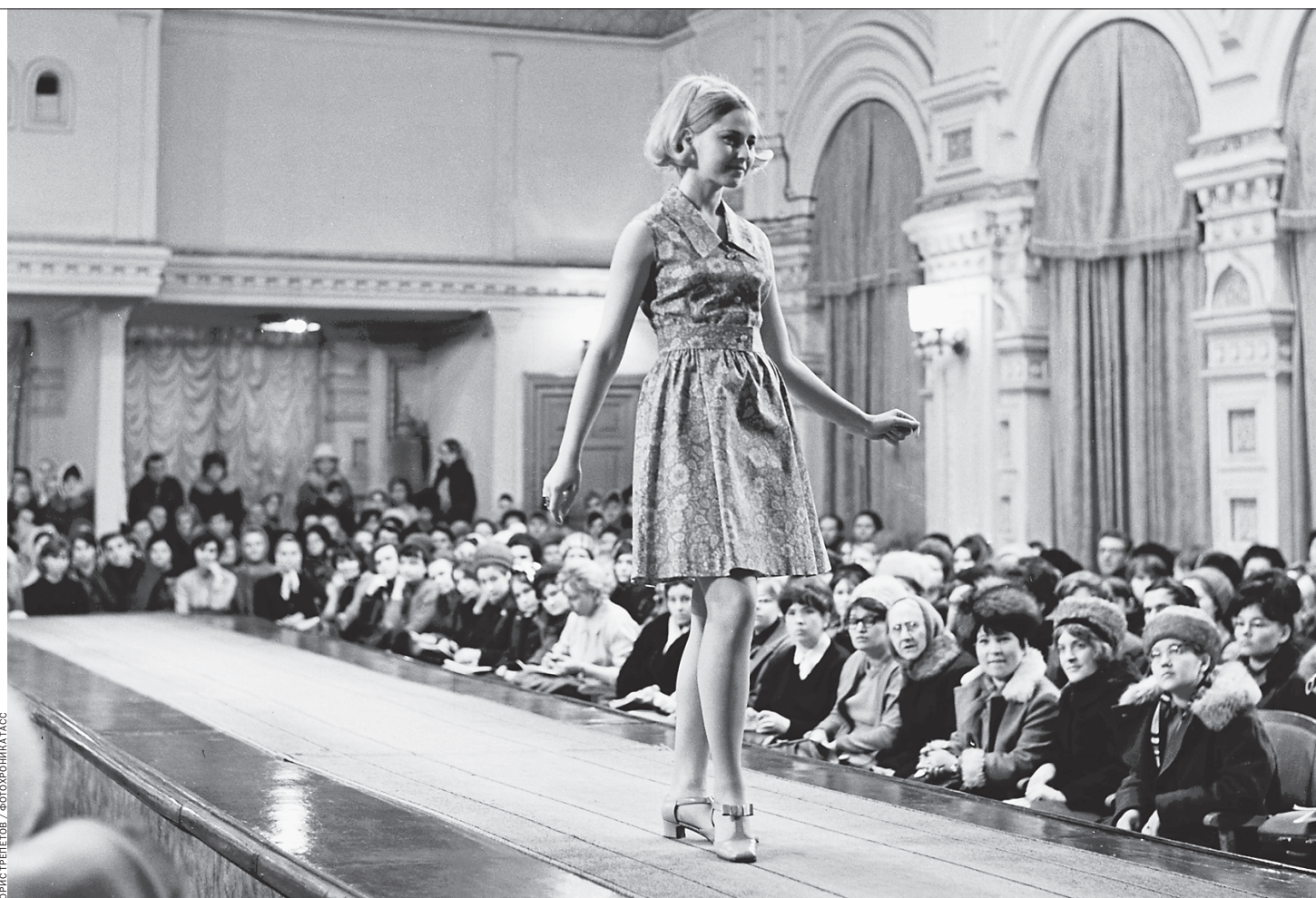
Везде, где собирались советские модницы, как на этом снимке из ГУМа, витал запах «Красной Москвы»

из страны. Зато он основал первую советскую парфюмерную фабрику в Санкт-Петербурге «Новая Заря». То, что создавалось для матери Николая II, стало «ароматом современной советской женщины».