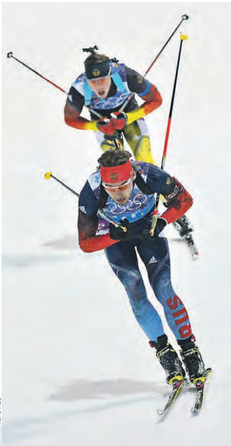
Соперничество биатлонистов Антона Шипулина и Симона Шемпа — главная интрига любого соревнования по биатлону

В зимней олимпийской программе полтора десятка видов спорта. Российско-немецкие «пересечения» произойдут не во всех. Германия, допустим, сильна в горных лыжах, а Россия — нет, зато в фигурном катании ситуация обратная. Но в некоторых жанрах «пересечения» будут просто грандиозными по интриге.