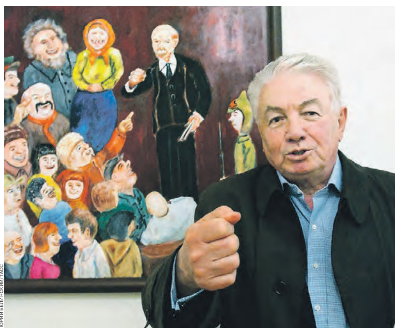
Владимир Войнович: «Меня немцы обычно сравнивают с Ярославом Гашеком»

— Я уехал из СССР по политическим причинам. А тут оказывается, что я «отягчен еврейской фамилией» и не «уехал», а именно «бежал из СССР». Мне приходилось знакомить людей со своей разветвленной родословной... Эта история имела еще одно продолжение. Когда мне исполнилось 60 лет, город Мюнхен решил отметить мой юбилей и устроил в мою честь вечер. В местной газете был такой анонс (на немецком): «Место, где звучит настоящая русская речь. Таджикский сатирик будет читать из своих произведений». Я прихожу, а там на каждом стуле разложены листки с моей биографией, и там опять написано, что «отягченный еврейской фамилией, он вынужден был бежать из Советского Союза». Я сильно ра-