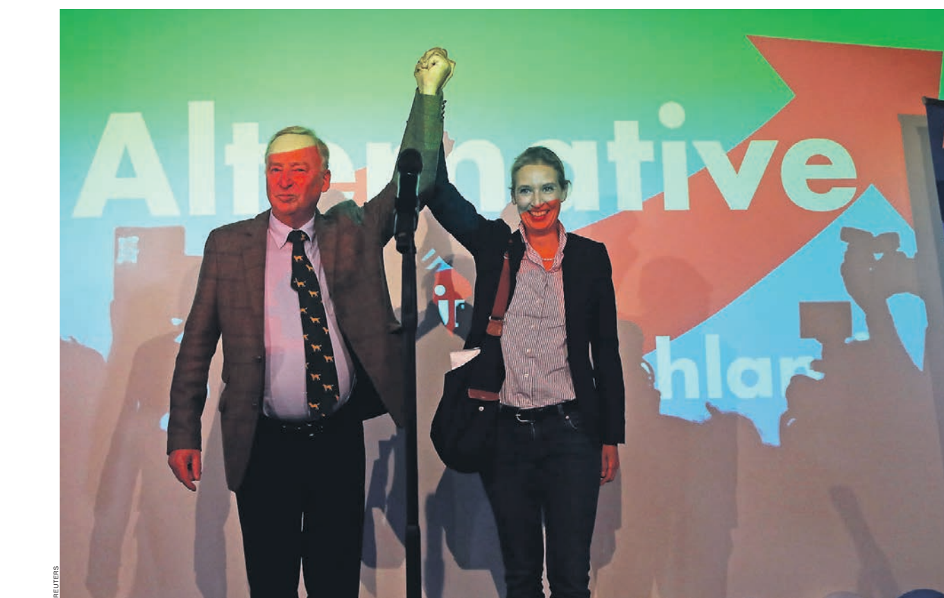
Одни из лидеров «Альтернативы» Александру Гауланд и Алису Вейдлер: результаты выборов выше любых ожиданий

Можно вспомнить и неприятные исторические параллели. Действительно, в некото-