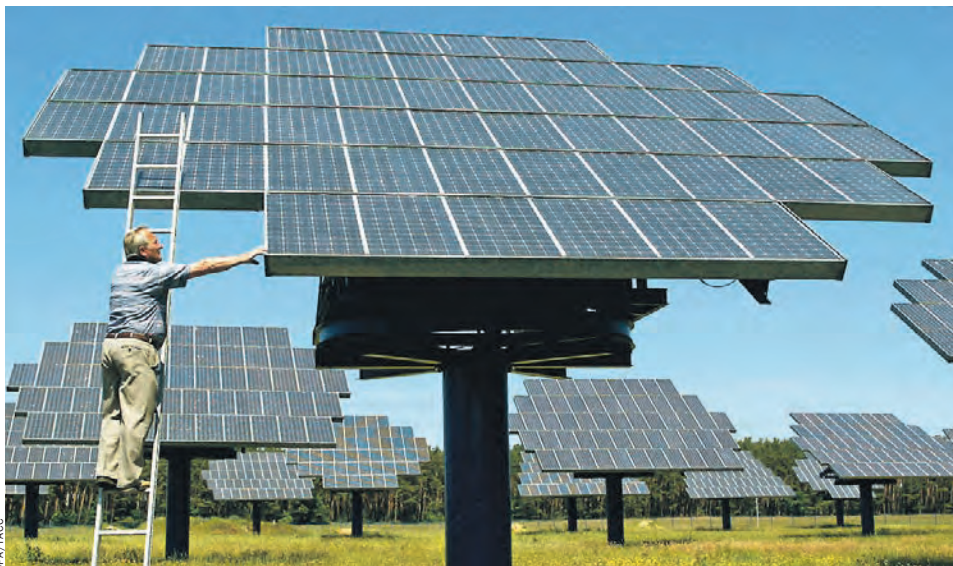
Наступили времена, когда солнечная энергия становится конкурентом газа. На фото: коллектор солнечной электростанции в немецком Кляйнкуе