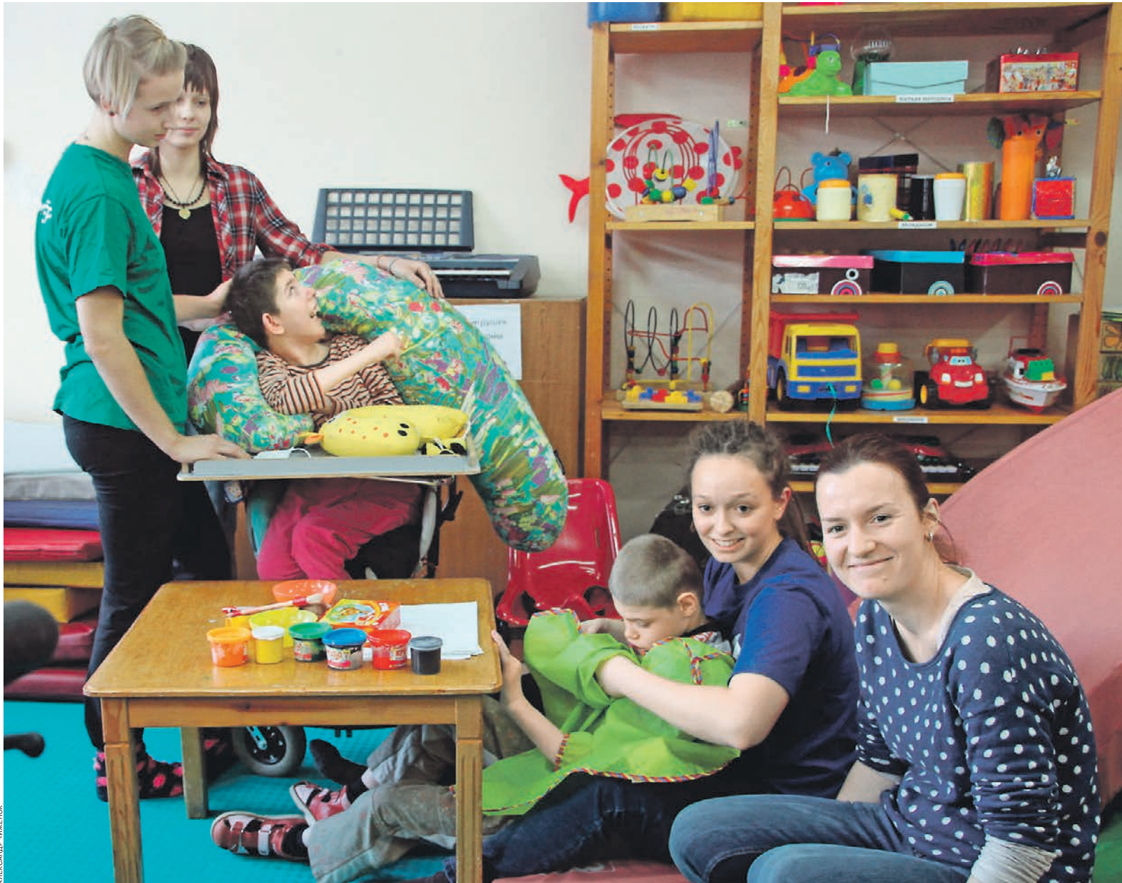
Волонтеры в Павловском детском интернате

Детский дом-интернат был рассчитан на 600 человек, отделение милосердия для самых тяжелых детей — на 150. С группой из 15 детей работала одна санитарка, никаких игровых комнат или занятий с детьми там не было. Принимали пищу дети в кроватках, а подмывали их тряпкой из ведра. Памперсов не было, запах стоял тяжелый. Первое, что сделали немцы, — купили много пеленок. Так началась программа «Павловск». Потом они привозили сюда игрушки, памперсы, инвалидные коляски — все, что обычно возят в детские дома начинающие благотворители. Но скоро поняли, что качество жизни детей в учреждении не меняется, потому что не меняется отношение к ним персонала. В год в Павловске умирали более 50 детей.