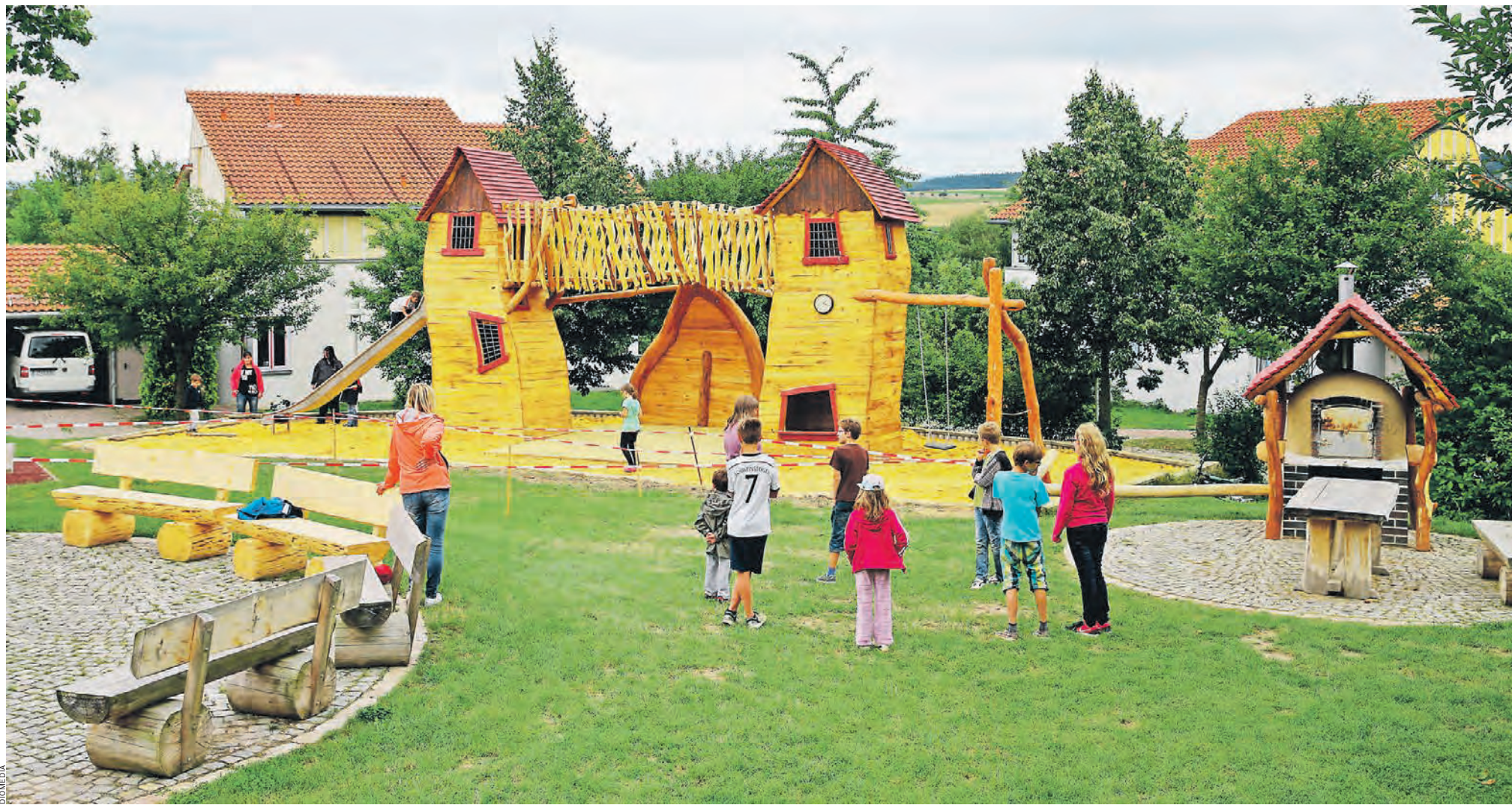
Детские деревни позволяют социальным сиротам расти в семье

Параллельно с работой с детьми социальный департамент округа ведет работу с родителями. Иногда требуется некоторое время, чтобы помочь привести жизнь взрослых в порядок, и тогда дети могут быть возвращены в семью. В остальных случаях контакт все равно остается. Если не с родителями, то с другими родственниками. К сожалению, не-