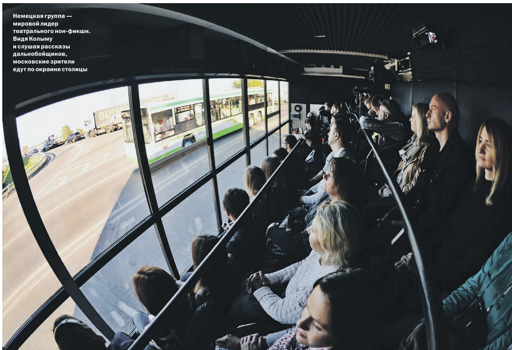
Немецкая группа — мировой лидер театрального нон-фикшн. Видя Колыму и слушая рассказы дальнотойщиков, московские зрители едут по окраине столицы