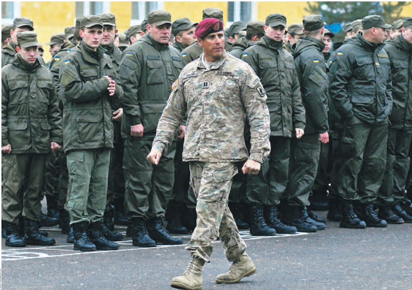
В Европе все больше растет убеждение, что Украина не должна быть бастионом и «острием копья» ни для русских, ни для западноевропейцев, ни для американцев. На фото: американский офицер на учениях в Украинской академии сухопутных войск

В истории отношений между Германией и Россией было много взлетов и падений. Времена бывали и очень хорошими, и очень плохими. Наши страны оказывались то близкими союзниками, например объединившись против Наполеона, то заклятыми врагами, как в годы Первой и Второй мировых войн. После завершения холодной войны мы, казалось, жили душа в душу. Михаил Горбачев согласился на воссоединение Германии, хотя у него была возможность сказать «нет». Тогдашний федеральный президент Рихард фон Вайцзеккер подчеркивал: «Мы не должны допустить, чтобы та стена, которую мы сейчасносим, снова была возведена на тысячу километров дальше к Востоку».