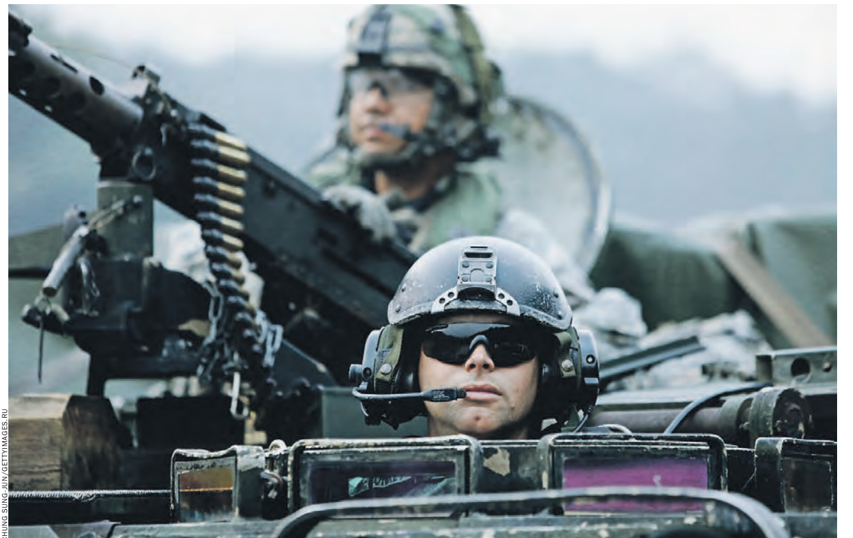
Американские танкисты на сентябрьских военных учениях в Южной Корее. Кого бы ни защищали иностранцы, корейцы всегда к ним будут относиться настороженно. Таковы уроки истории

Остается незатронутым только один аспект — российский. Что с ним? А тут все просто: для Москвы