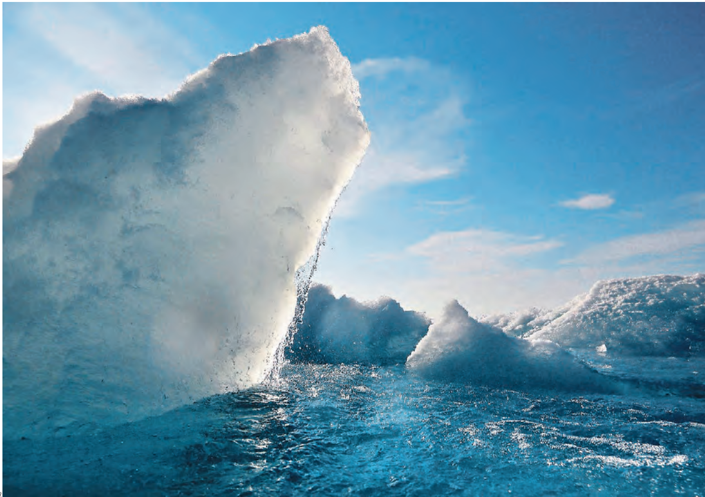
Тающие льды Арктики, лесные пожары в Восточной Сибири, мощнейшие ураганы в США — все это давно должно заставить крупнейшие мировые державы иначе взглянуть на экологию

В России плюсы и минусы изменения климата связаны друг с другом так тесно, как, возможно, нигде. «Глобальное потепление несет с собой более благоприятные условия и улучшает экономический потенциал этого региона», — сказал президент Путин в марте во время саммита Арктического совета в Архангельске. 10% российского ВВП приходится на предприятия, работающие в регионе; более мягкие зимы обеспечивают более оптимальные условия для разведки газовых и нефтяных месторождений, раньше начинается сезон навигации. В отличие от западных нефтяных концернов, Россия не отказалась от поисков нефти в уже не таких вечных северных льдах. В более юж-