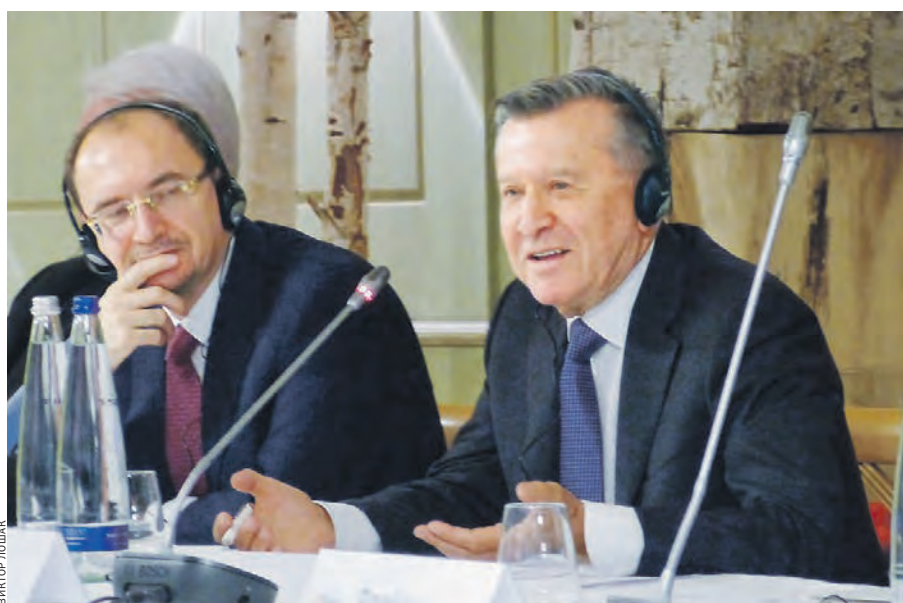
Во время встречи. Ректор Петербургского госуниверситета Николай Кропачев и председатель совета директоров «Газпрома», глава российского комитета «Петербургского диалога» Виктор Зубков

Сейчас среди планов «Петербургского диалога» большая встреча в Берлине. Ее местом может стать правительственная Ратуша. Тема — развитие сельского хозяйства и сохранение плодородия земель. «Пора говорить о том, что нас объединяет», — к радости российской стороны, заметил господин Пофалла. Позже среди участников встречи прошел слух, что на заседании форума может появиться Ангела Меркель.