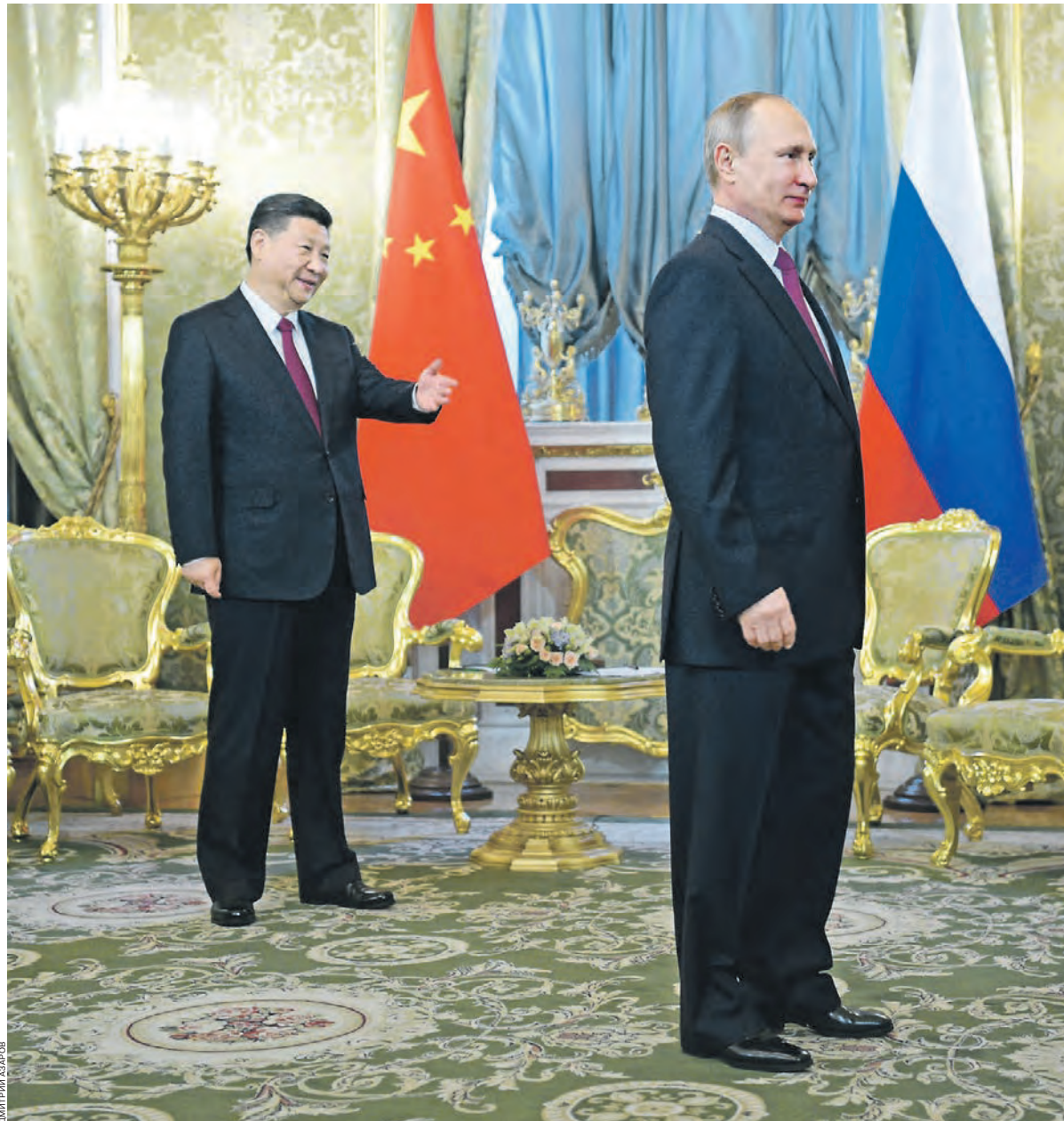
Идея по указанному Китаем пути экономического взаимодействия, ни России, ни Германии не следует забывать о собственных интересах. На фото: президент России Владимир Путин и председатель КНР Си Цзиньпин во время июльской встречи в Кремле

Долгосрочная стратегия Китая в полной мере проявляется в грандиозном инфраструктурном проекте «Один пояс — один путь», осуществляемом по китайским пра-