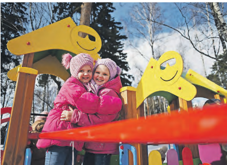
Маленькие жители Детской деревни — SOS Томлино получили шанс на беззаботное детство

Бюджет российской организации «Детские деревни — SOS» — около 430 млн руб. в год, в ней работают 300 человек: социальные педагоги, психологи, воспитатели, администраторы, бухгалтеры, фандрайзеры. Средний бюджет одной семьи, в которой воспитываются пять-семь детей, составляет примерно 3 млн руб. в год (50 тыс. руб. x 5 детей x 12 месяцев) с учетом всех расходов деревни (оплата труда персонала, включая SOS-мам и SOS-тетей, налоги, полная психолого-педагогическая поддержка развития детей, социально-психологическое сопровожде-