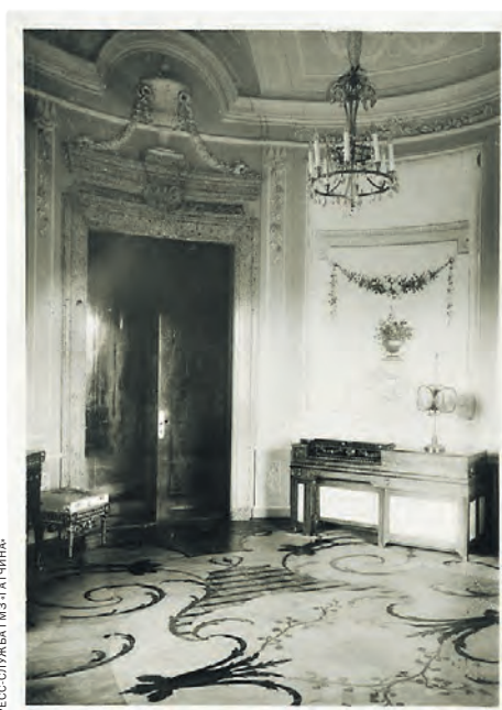
Гатчинский музей получил фотографии старинных интерьеров дворца, которые помогут при его реконструкции

20 сентября министр правительства ФРГ по вопросам культуры Моника Грюттерс вместе с официальным представителем Германо-Российского музейного диалога (DRMD) Германом Парцингером передала Гатчинскому дворцово-парковому музею-заповеднику 45 исторических фотографий из его фонда, которые считались пропавшими, но вдруг были обнаружены в интернете. Эти фотографии имеют особую ценность для продолжающейся реконструкции дворцово-паркового комплекса и его драгоценного интерьера.