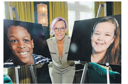
Ушла на год в деревню Как наша журналистка воспитывала немецких детей стр. 3