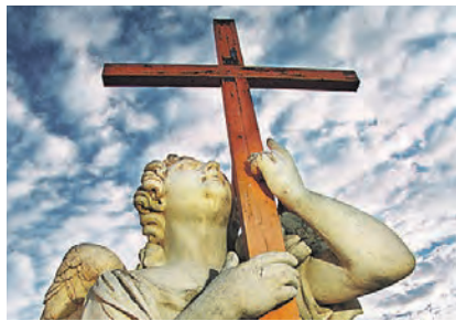
Российские лютеране К 500-летию Реформации стр. 13