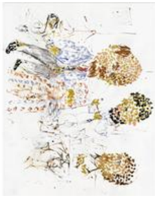
Работа Георга Базелица из серии "Русские картины" (1999)

Экспозиция представит около 200 работ. Темы свободы, миграции, экологии, прозрачности, человеческого достоинства, - все это нашло отражение в произведениях современных художников. Перед посетителями будут поставлены вопросы: "Что такое демократия?", "Кто осуществляет цензуру - общество, политика или СМИ?". Ответы придется искать уже самостоятельно. "Картина - это окно в мир. Искусство должно провоцировать и показывать то, что скрыто у нас внутри", - говорит председатель немецкого Фонда искусства и культуры Вальтер Смерлинг. Он вспоминает, как одна из участниц выставки - художница Алисия Кваде - сказала, что в будущем не будет больше границ. "Я - художник, а не политик, я могу себе это позволить", - ответила она на недоумение куратора с многолетним опытом. "Искусство может позволить себе все. Для него действительно не существует границ", - соглашается с художницей Вальтер Смерлинг.